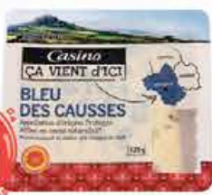
Bleu des causses AOP Casino 125g