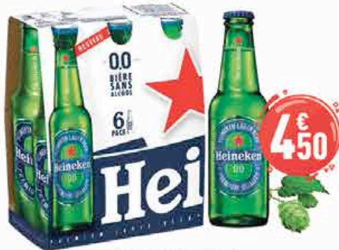
Heineken zéro le pack de 6x25cl