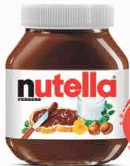
Pâte à tartiner Nutella 180g