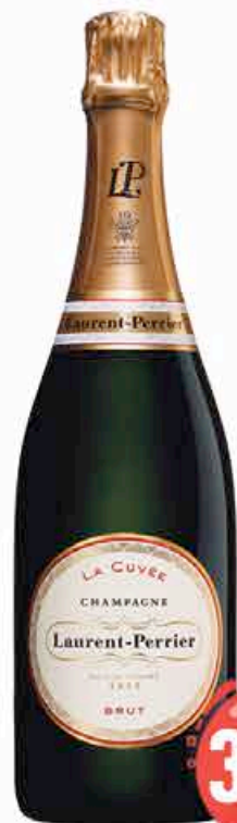
Champagne Laurent Perrier Brut 75cl