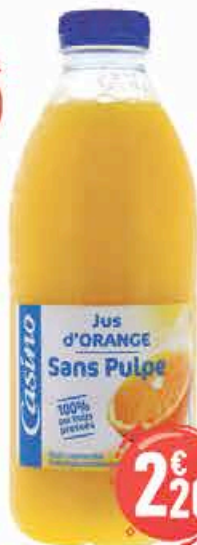
Jus d'orange sans pulpe Casino 1L