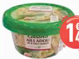
Ailladou Casino, ail et fines herbes 125g