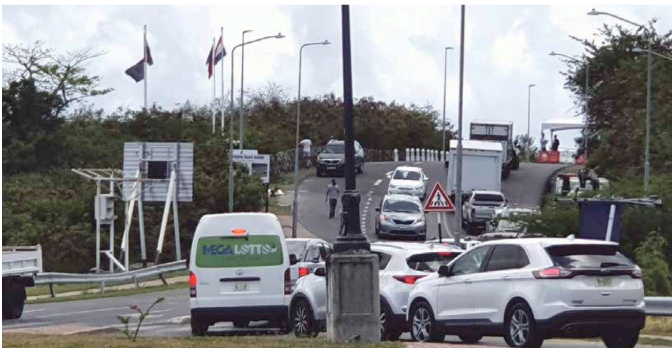
Photo d'archive : contrôle de la frontière pas les autorités françaises courant mai 2020