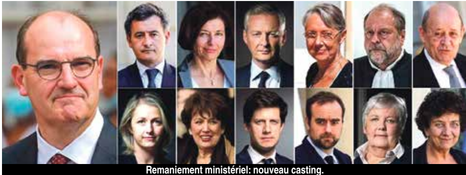
Remaniement ministériel: nouveau casting.

Plus qu'un remaniement ministériel, c'est un véritable changement de gouvernement que le président Emmanuel Macron avait annoncé pour cette seconde partie de son quinquennat. Une étape clé pour le chef de l'Etat pour tenter une relance économique mais également de son quinquennat. Le lever de rideau de ce nouvel acte a eu lieu hier. C'est plus un jeu de chaises musicales auquel on assiste qu'à un profond remaniement. Sébastien Lecornu succède à Annick Girardin aux Outre-mer dans le gouvernement Castex.