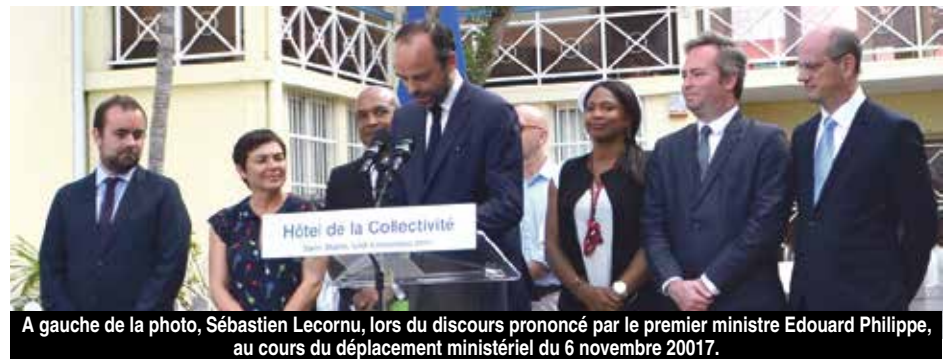
A gauche de la photo, Sébastien Lecornu, lors du discours prononcé par le premier ministre Edouard Philippe, au cours du déplacement ministériel du 6 novembre 2017.

22 juin dernier, avait annoncé revenir en janvier prochain, une fois le document PPRN finalisé. Reste à savoir si son successeur suivra ce même programme... La passation de pouvoir entre les deux ministres a lieu ce jour, à l'Hôtel de Montmorin. V.D.