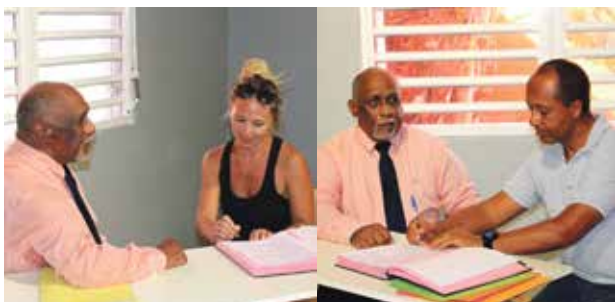
Signature des deux dernières conventions, entre le Collège de Quartier d'Orléans et la Présidente de l'Association Tous à l'eau et le Président de Sécurité Routière SXM.

Apprentissage des gestes de premiers secours ou comment devenir pompier avec les Sapeurs-Pompiers de Saint-Martin, sensibilisation à l'environnement en classe et sur le terrain avec la Réserve Natu-