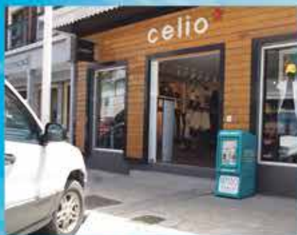
CELIO RUE DU GENERAL DE GAULLE