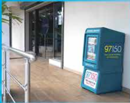
L'EXPRESS BAIE NETTLÉ