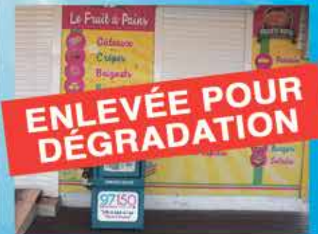
FRUIT A PAIN QUARTIER D'ORLEANS