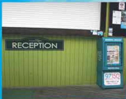
LOTERIE FARM PIC PARADIS