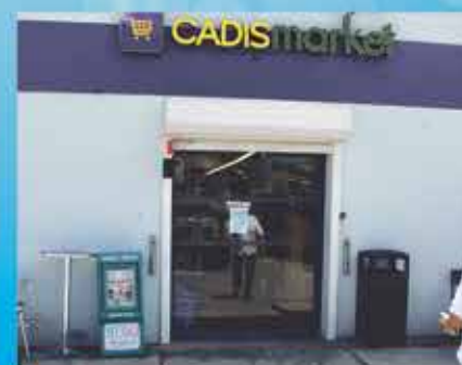
CADISMARKET BAIE ORIENTALE