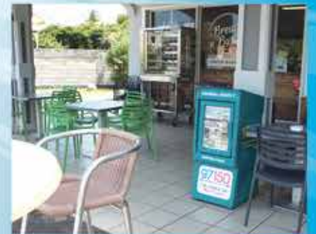
BREAD N'BUTTER OYSTER POND