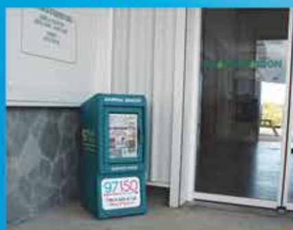
GRAND MAISON HOPE ESTATE