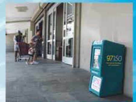
CARREFOUR COLE BAY