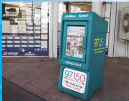
SUPER U HOWELL CENTER