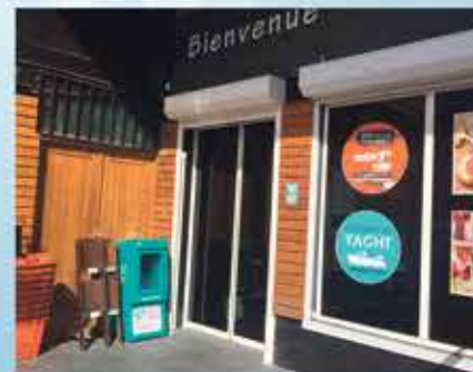
COCCI MARKET CUL DE SAC