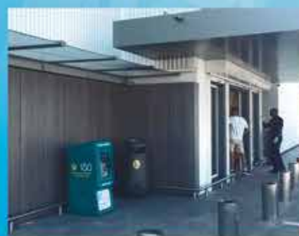
SUPER U HOPE ESTATE