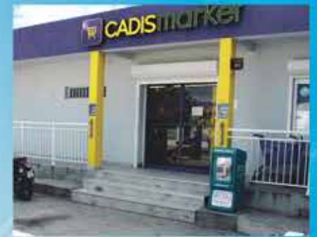
CADISMARKET BAIE NETTLE