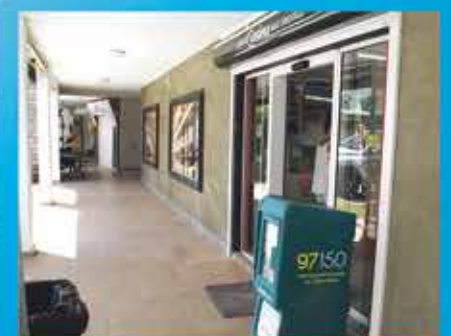
PETIT CASINO BAIE ORIENTALE