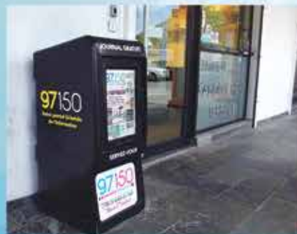
L'EXPRESS HOPE ESTATE