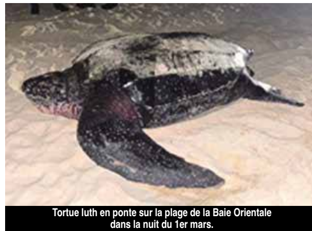
Tortue luth en ponte sur la plage de la Baie Orientale dans la nuit du 1er mars.

La saison a débuté le 1er mars avec une première ponte de tortue luth sur la plage de la Baie Orientale. Elle va perdurer jusqu'au mois de novembre et il s'agit de ne pas la perturber. Adopter les bons réflexes sera l'un des thèmes abordés lors de la réunion organisée par la Réserve Nationale le 13 mars prochain.