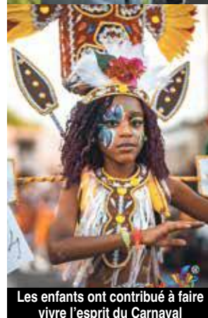
Les enfants ont contribué à faire vivre l'esprit du Carnaval