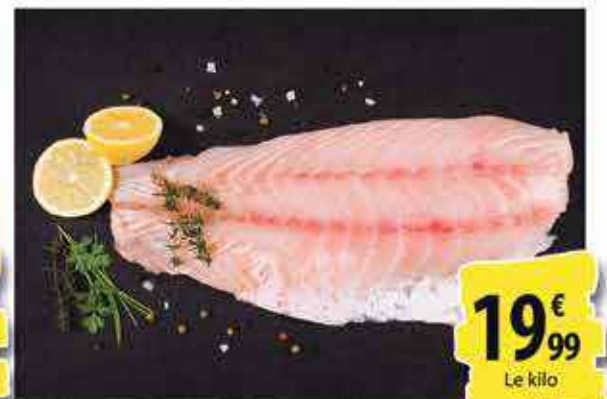
TURBOT DE PÊCHE ARRIVAGE AVION - AU RAYON POISSONNERIE