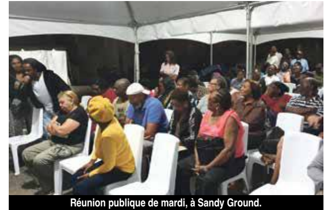
Réunion publique de mardi, à Sandy Ground.

chacun des quartiers. Des temps d'échange qui ont mis en exergue l'absence criante d'infrastructures et d'activités pour la jeunesse, les aînés et la population toute entière : des parcs et aires de jeux, des lieux de lecture publique, les transports publics, des associations sportives et culturelles, un terrain pour les sports mécaniques ... Tous des facteurs de création de lien social et de construction de la jeunesse. Des défaillances passées, imputables tant aux différentes mandatures qui se sont succédé ces dernières décennies, qu'à l'Etat, et dont les conséquences imparables sont la détresse sociale, une délinquance et la pauvreté qui s'étalent aujourd'hui au grand jour. Le pôle social de la Collectivité et les acteurs sociaux ont joué le jeu et ont pris note de l'ensemble des demandes et des