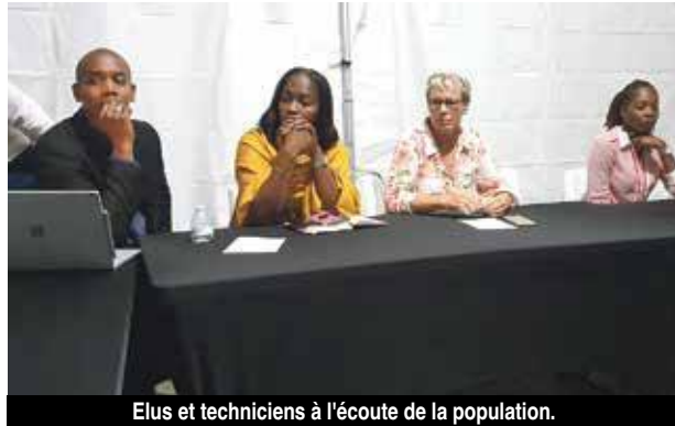
Elus et techniciens à l'écoute de la population.

Ouvertes officiellement mardi dernier, les assises du social et de l'insertion se sont poursuivies toute la semaine. La dernière réunion publique dans les quartiers se tient ce soir, à Quartier d'Orléans, à partir de 18 heures sur le parking du terrain de basket.