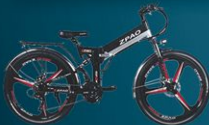
Vélo électrique pliable adulte valeur $1450 OFFERT par