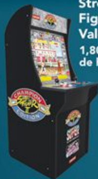
Street Fighter II Valeur 450€ 1,80 mètres de haut