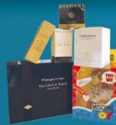
6 lots parfums, coffrets & cosmétiques OFFERTS par