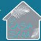
Une bouteille de 1l de rhum + coffret cadeau + 25$ offert au restaurant Topper's TOPPER'S RHUM