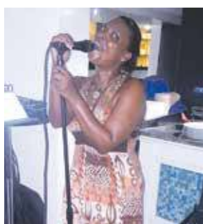
'Jazz-Pop' pour accompagner en beauté votre repas