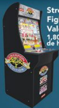
Street Fighter II Valeur 450€ 1,80 mètres de haut