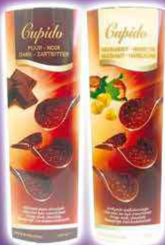
CUPIDO DIFFÉRENTES VARIÉTÉS 125G - LE KILO : 7,92€