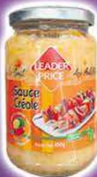
SAUCE CRÉOLE LEADER PRICE 300G - LE KILO : 14,17€