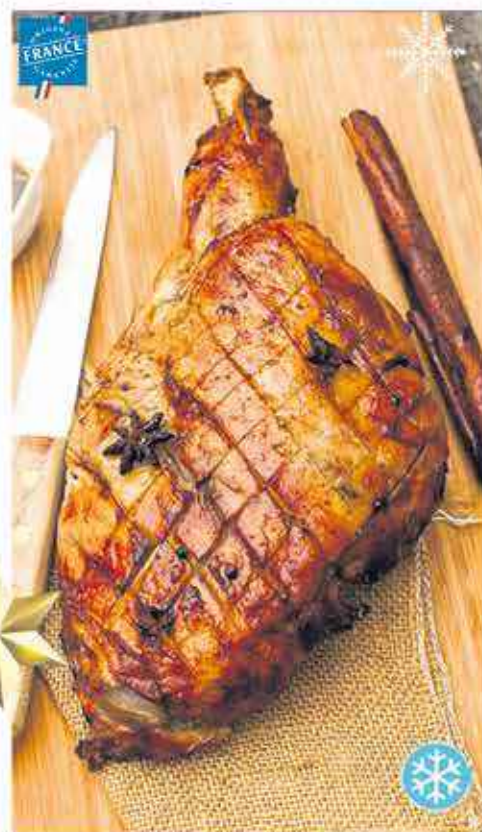
ÉPAULE DE NOËL 3,100KG - LE KILO : 5,32€