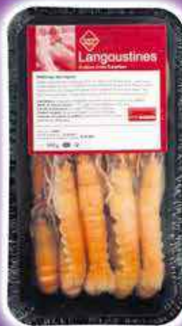
LANGOUSTINES X13/15 PIÈCES LEADER PRICE 500G - LE KILO : 21€