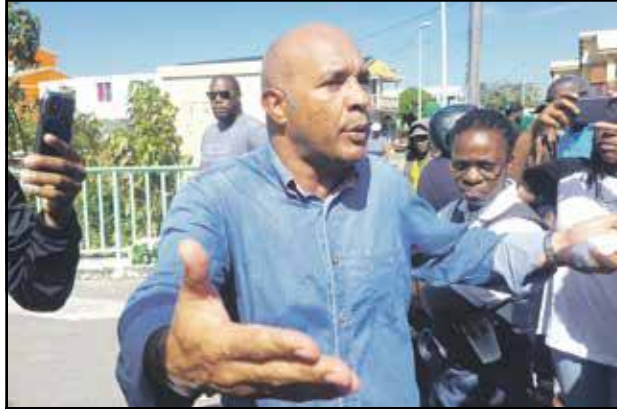
Le président Gibbs, accompagné d'élus, s'est rendu sur les différents points de blocage dans la journée de vendredi pour écouter la population. La préfète Feucher est elle aussi allée à la rencontre de la population, à Grand Case et à Quartier d'Orléans, la journée de vendredi.

Loin d'apaiser les tensions, le déploiement en masse des forces de l'ordre toute la journée d'hier aux endroits stratégiques des routes a eu pour conséquence d'exacerber les tensions. A Grand Case, les manifestants et militaires ont « joué au chat et à la souris » : au même moment que des barrages étaient démontés pour laisser passer la circulation des voitures, d'autres étaient érigés un peu plus loin. A Quartier d'Orléans et à Sandy Ground, la route principale est restée bloquée encore toute la journée, les barrages n'ont pas été évacués. La tension a été palpable encore hier toute la journée dans ces quartiers et en début de soirée, on pouvait encore entendre au loin des détonations. Toutefois, en fin de journée de ce lundi, la préfecture annonçait la réouverture de la majorité des établissements scolaires du primaire et du secondaire pour ce jour, mardi 17 décembre, à l'exception des écoles et du collège de Quartier d'Orléans et des écoles du quartier de Sandy Ground.