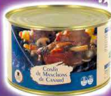
CONFIT DE MANCHONS DE CANARD LEADER PRICE 1,35KG - LE KILO : 5,56€