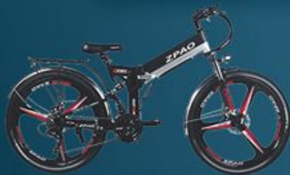
Vélo électrique pliable adulte valeur $1450 OFFERT par