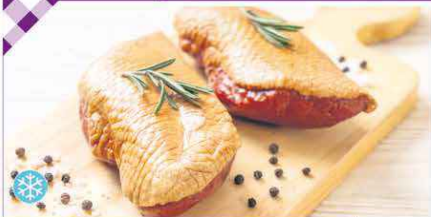
MAGRET DE CANARD ERNEST SOULARD 350G - LE KILO : 15,71€