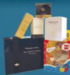
6 lots parfums, coffrets & cosmétiques OFFERTS par Lipstick Parfumerie