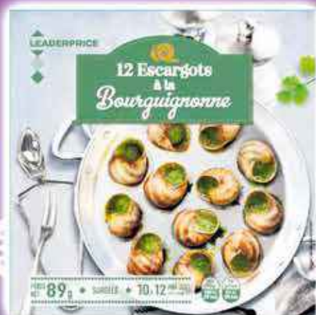
12 ESCARGOTS À LA BOURGUIGNONNE LEADER PRICE 89G - LE KILO : 39,36€