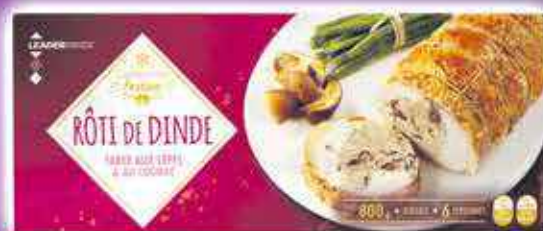
RÔTI DE DINDE FARCE AUX CÈPES ET AU COGNAC LEADER PRICE 800G - LE KILO : 14,88€