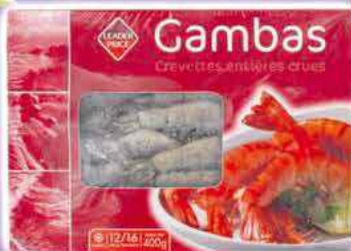
CREVETTES ENTIÈRES CRUES LEADER PRICE 400G - LE KILO : 13,75€