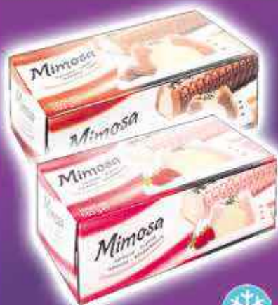
BÛCHE GLACÉE MIMOSA DIFFÉRENTS PARFUMS 504G - LE KILO : 3,95€