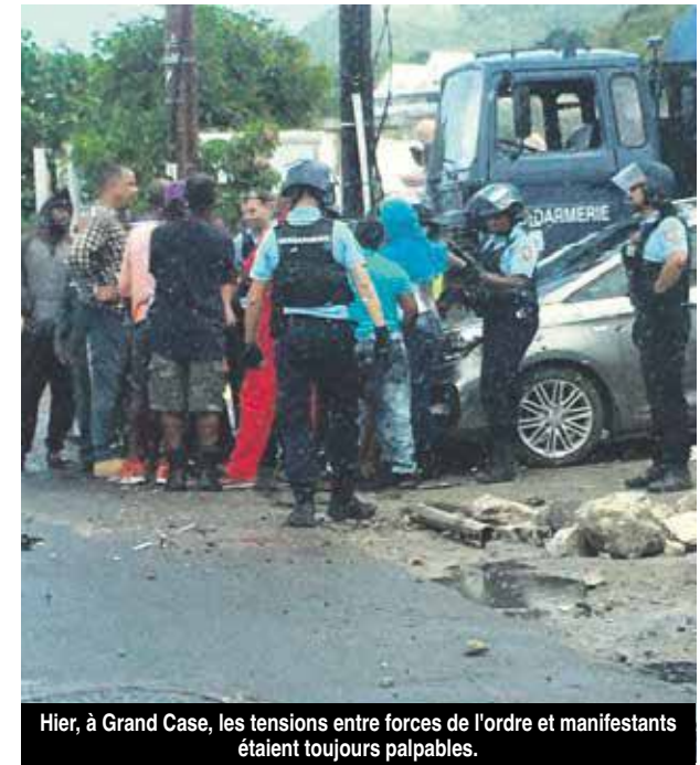
Hier, à Grand Case, les tensions entre forces de l'ordre et manifestants étaient toujours palpables.

10 heures à la gare maritime située sur le front de mer de Marigot. Un peu plus tard dans la soirée, la Collectivité annonçait qu'elle n'était pas en mesure d'organiser les ramassages scolaire ni de procéder au nettoyage des écoles, et recommandait aux parents de ne pas envoyer leurs enfants à l'école. V.D.