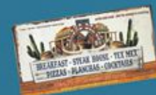
Un repas Valeur 50€ OFFERT par