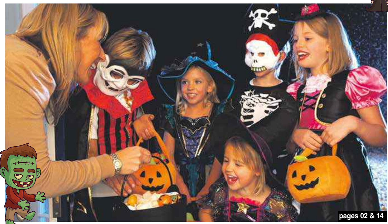
pages 02 & 14

Toussaint : Un mur végétal digital au cimetière de Marigot page 07