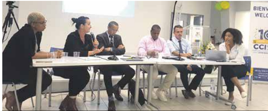
Réunis à l'occasion des 10 ans de la CCISM, élus, personnels, conseillers techniques et membres associés réfléchissent ensemble à la voie que doit prendre la chambre consulaire pour pouvoir, demain, répondre au plus près aux attentes des entrepreneurs.

Comme annoncé par la CCISM lors de la cérémonie d'ouverture des événements programmés pour fêter ses 10 ans, la première édition du « Prix de l'Entrepreneur René Mathon » est lancée. Les candidatures doivent être adressées avant le 15 novembre.