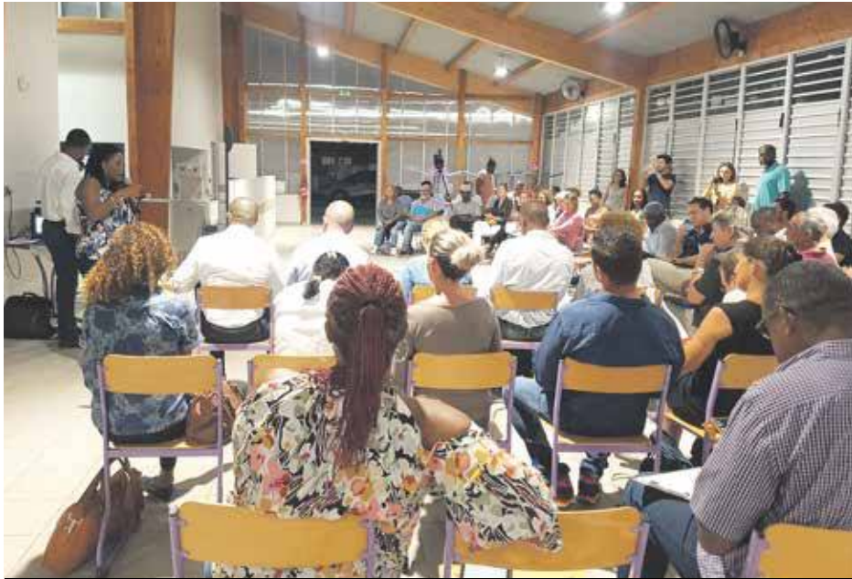
La première réunion du COTECH, tenue mardi dernier au Lycée professionnel de Concordia, a réuni une soixantaine de personnes.

C'est un calendrier serré qu'a fixé la Collectivité pour organiser cette approche de concertation réunissant des techniciens, des professionnels et la population. Les COTECH, des réunions de travail qui doivent être force de propositions pour transmettre à l'Etat, avant la clôture de l'enquête publique, un contre-projet de PPRn. La première réunion a eu lieu mardi, et la seconde hier soir.