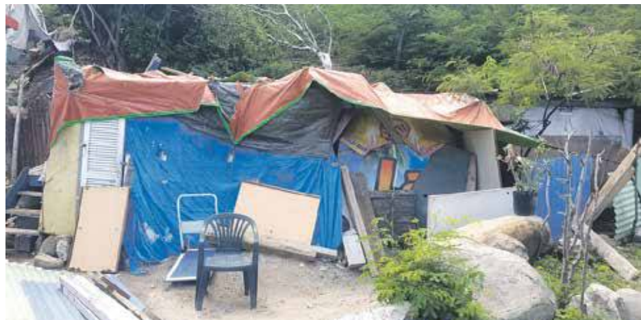
Quel mot employer pour désigner cet endroit dans lequel vit un couple depuis deux ans ? Nous n'en avons pas trouvé...