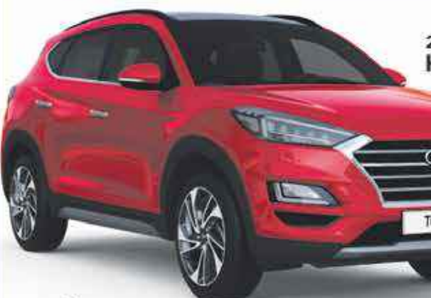
2019 Hyundai Tucson

À partir de 17,990 €* << 337 € mois sur 59 mois