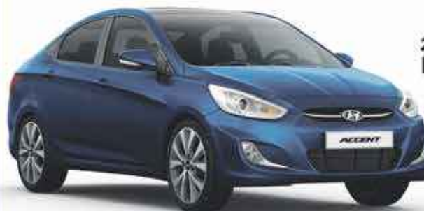
2020 Hyundai Accent

À partir de 13,490 €* << 253 € mois sur 59 mois