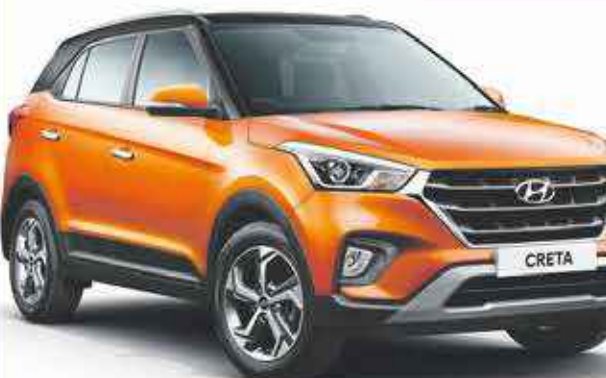
2019 Hyundai Creta

À partir de 14,990 €* << 281 € mois sur 59 mois