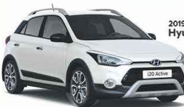
2019 Hyundai i20 Active

À partir de 13,490 €* << 253 € mois sur 59 mois