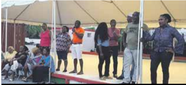
De nombreuses personnes se sont succédé à la tribune pour exprimer leur colère.

Refuser la méthode employée par les représentants de l'Etat et également le fond du PPRn révisé qui a été présenté à la population par quartiers, sont les leitmotivs d'une partie de la population de Saint-Martin qui est en train de s'organiser pour faire bloc face à l'Etat. Un premier rassemblement populaire, mardi dernier, a réuni près de 200 personnes.