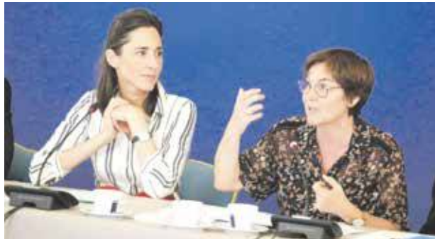
La Ministre des Outre-mer Annick Girardin exposait dans la semaine l'appel à projets.

Dans le cadre de la stratégie « zéro déchet en outre-mer », initiée par Annick Girardin, le gouvernement lance un appel à projet visant à réduire l'impact des déchets dans la mer. Les candidats ont jusqu'au 8 novembre 2019 pour déposer leur candidature afin de bénéficier d'une aide. Une enveloppe de 300 000 euros sera répartie entre les différents projets sélectionnés