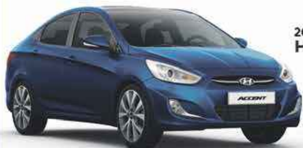
2020 Hyundai Accent

À partir de 13,490 €* << 253 € mois sur 59 mois