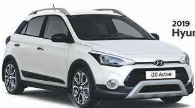
2019 Hyundai i20 Active

À partir de 13,490 €* << 253 € mois sur 59 mois