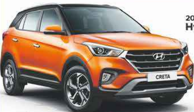
2019 Hyundai Creta

À partir de 14,990 €* << 281 € mois sur 59 mois