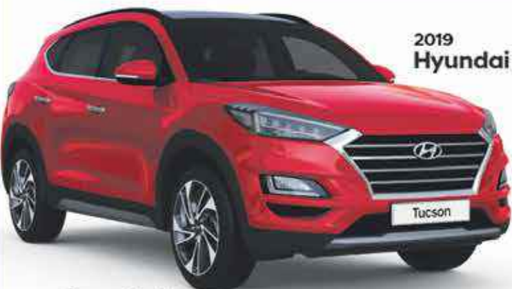
2019 Hyundai Tucson

À partir de 17,990 €* << 337 € mois sur 59 mois