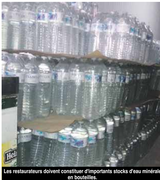
Les restaurateurs doivent constituer d'importants stocks d'eau minérale en bouteilles.

Depuis le 21 juin dernier, la révélation de la présence de bromates dans l'eau de ville a conduit à une interdiction formelle de consommer cette eau pour boire, cuisiner ou encore se laver les dents. Une interdiction qui engendre des coûts importants pour les ménages en général et pour les restaurateurs en particulier. Car L'eau minérale n'a pas le même prix que l'eau de ville !