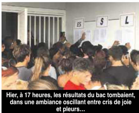
Hier, à 17 heures, les résultats du bac tombaient, dans une ambiance oscillant entre cris de joie et pleurs...

Le supplice de l'attente des résultats du baccalauréat a pris fin hier en fin de journée, de façon anticipée, pour les candidats saint-martinois. La rumeur gonflait au sujet de cette sortie anticipée, au fur et à mesure que les heures de la journée s'étiolaient.