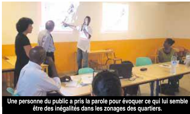
Une personne du public a pris la parole pour évoquer ce qui lui semble être des inégalités dans les zonages des quartiers.

Et la critique générale revient également sur l'absence de la Collectivité à ces réunions, dans la mesure où la préfète indique chaque fois que les projets de révision s'élaborent avec les services de la Collectivité : « Nous voulons nos élus auprès de nous... Là, nous avons l'impression que l'Etat cherche à rem-