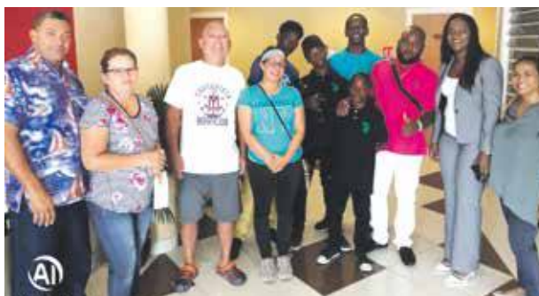
La 1ère vice-présidente rencontrait dimanche les victimes de l'accident et les cinq jeunes, ces derniers reçus en héros.

Les circonstances de l'accident ne sont pas pour l'heure encore formellement connues. Le chauffeur aurait fait une mauvaise manipulation en voulant se garer à cet endroit. Les jeunes ont sauté dans l'eau pour aider les victimes à sortir du bus. Tous les passagers victimes de l'accident ont été transportés à l'hôpital dont deux dans un état grave suite à l'absorption d'eau de mer. Tous les autres sont res-