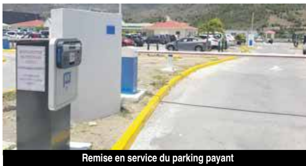
Remise en service du parking payant

C'est en décembre 2016, et après de longues tractations avec le propriétaire du terrain, que la Collectivité a finalement acté l'imputation à son budget de la somme de 6.5 millions d'euros et la transaction a été réalisée en fin d'année 2017. Mais entre-temps, en septembre 2017, l'ouragan Irma est passé par là et a imposé par ses dégâts de revoir à la baisse certaines prétentions pour l'île, avec pour priorité la reconstruction des in-