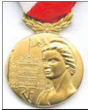
Médaille d'Or de la Sécurité Intérieure.

nue dépassant le cadre normal de service, rendus par toute personne, au cours de sa carrière ou dans le cadre d'un engagement citoyen ou bénévole, pour des missions ou actions signalées relevant de la sécurité intérieure. Une reconnaissance de la République que les hommes et les femmes de la sécurité civile et les sapeurs-pompiers de Saint-Martin peuvent arborer avec une grande fierté. V.D.