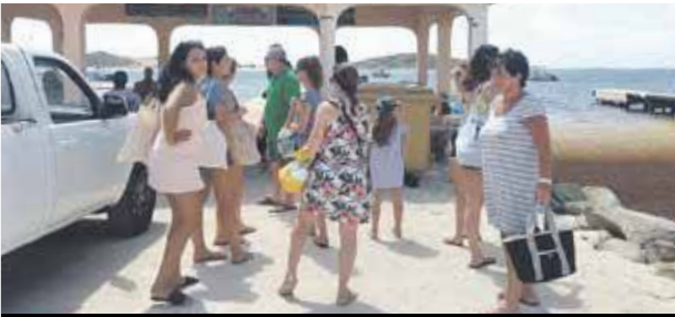
Mardi matin, les passagers qui souhaitent se rendre sur l'île Pinel repartaient bredouilles : les passeurs leur expliquaient qu'ils manifestaient leur mécontentement vis-à-vis des autorités.

Les contrôles opérés par les gendarmes en début de semaine, lundi de la Pentecôte, auprès des passeurs de Pinel, a soulevé la colère de ces derniers qui ont cessé la journée de mardi leurs rotations vers l'île Pinel. Sans rendez-vous acté auprès des autorités locales, ils informaient rester à l'arrêt.