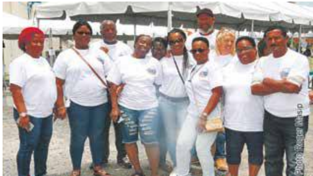
Les membres du Conseil de quartier n° 4 en compagnie de leur président (avec la casquette)

Le Conseil de quartier n° 4 a organisé, samedi dernier de 9h00 à 16h30, le Forum Sociétal et des Métiers sur le parking du centre culturel de Sandy Ground. Un événement qui a eu lieu en partenariat avec la Collectivité et la préfecture des îles du Nord.