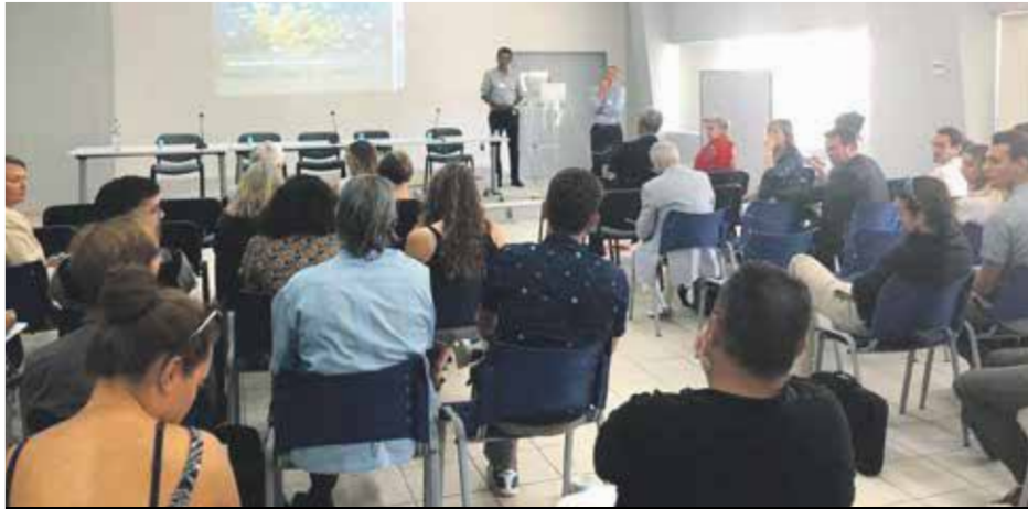
Le comité national IFRECOR réunissait hier à la CCISM les 38 participants venus des quatre coins du monde.

L'organisation nationale oeuvrant pour la sauvegarde des récifs coralliens, IFRECOR, et ses comités locaux, se réunissent pour la première fois à Saint-Martin toute cette semaine. L'occasion pour les acteurs locaux de la Réserve Naturelle de faire entendre la voix de Saint-Martin comme une voix différente de celle de la Guadeloupe. Et de partager avec l'ensemble des comités locaux le retour de l'expérience Irma.