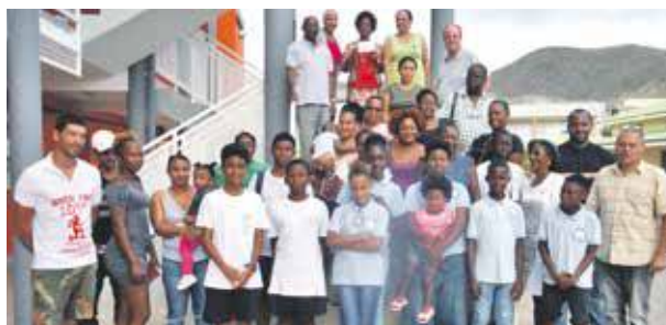
Elèves, parents et enseignants qui participent au projet de voyage éducatif

Des élèves de deux classes de 6e du collège Mont des Accords participent à un voyage de découverte en Guadeloupe, dans le cadre d'un projet pédagogique. Le voyage est proposé en relation avec le projet d'Aire Marine Educative (AME) initié durant l'année scolaire 2017-2018, par l'équipe enseignante de la SEGPA (Section d'enseignement général professionnel adapté).