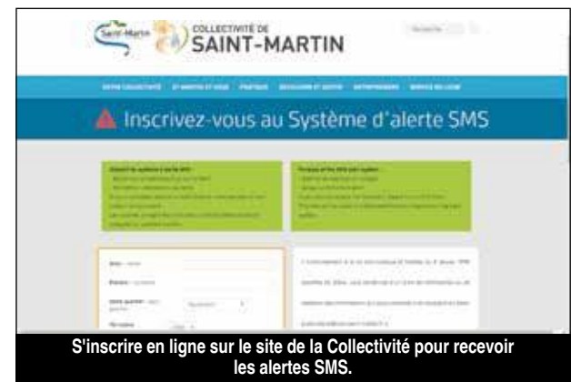
S'inscrire en ligne sur le site de la Collectivité pour recevoir les alertes SMS.

Suite à l'épisode Irma, les abris cycloniques ont été revus. Ils sont