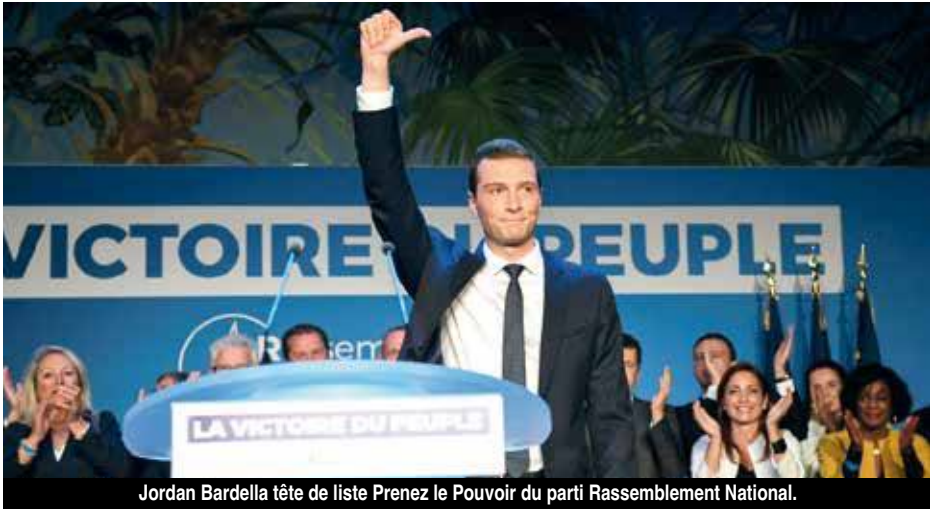
Jordan Bardella tête de liste Prenez le Pouvoir du parti Rassemblement National.

La liste Rassemblement National (RN) dirigée par Jordan Bardella et soutenue par Marine Le Pen a fait carton plein dans les Outre-mer français de ce côté-ci de l'Atlantique (Guadeloupe, Guyane, Saint-Martin, Saint-Barthélemy), à l'exception de la Martinique où la liste La République en Marche (LREM) s'est imposée. L'île de la Réunion, Mayotte, mais aussi le fief de la ministre des Outre-mer, Annick Girardin, Saint-Pierre et Miquelon ont également plébiscité les idées du parti RN.