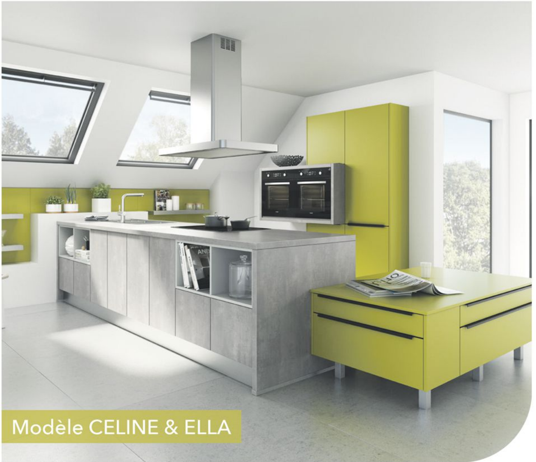
Modèle CELINE & ELLA

Remise de 50% valable pour l'achat d'une cuisine équipée (au moins un électroménager inclus dans le bon de commande) d'un montant minimal de 3.000 euros de meubles (hors plans de travail, électroménager, sanitaires, services, accessoires).