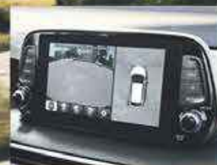
Caméra à angle 360°