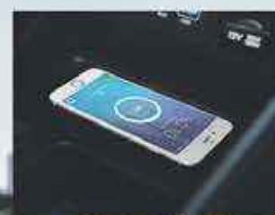
Recharge sans fil