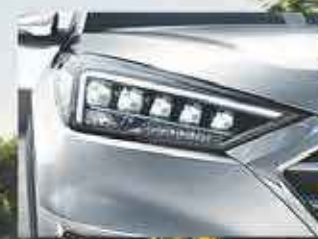
Phares à décharge haute intensité