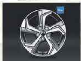
Jantes sportives en alliage