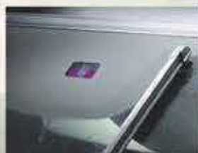
Essuie-glaces sensibles à la pluie