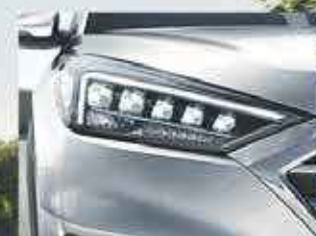
Phares à décharge haute intensité