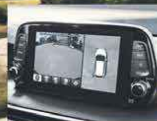
Caméra à angle 360°