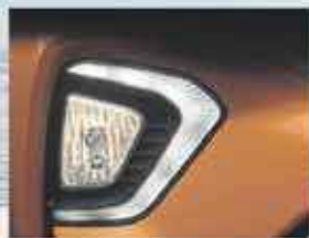
Feux diurnes en LED