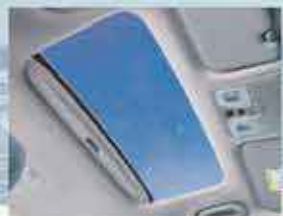
Toit ouvrant électrique intelligent