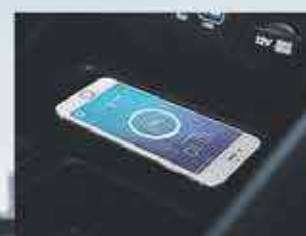
Recharge sans fil