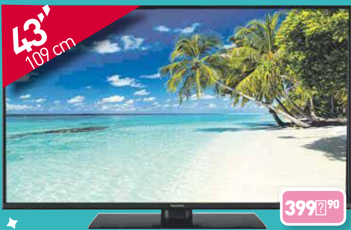
PANASONIC LED 43" TX43FX50E UHD SMART TV , Résolution: 3840 x 2160 px 4K Ultra HD Technologie: LED HDR TV intelligente: oui Connectivité: Wi-Fi Ethernet LAN Miracast Connexions: USB 2.0 x 2 RJ45 x 1 HDMI x 2 Réf 163669