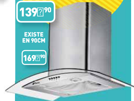
HOTTE 60 CHEMINÉE FORTEX SS60GHD Eclairage 2 x 28W. Eco halogène. Cheminée extensible de 55 à 92 cm. Réf : 159566