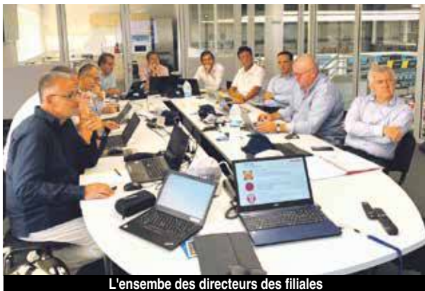
L'ensemble des directeurs des filiales