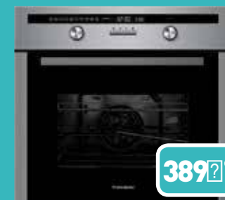
CUISSON 3FX IND THOMSON Largeur 60 cm. Table de cuisson gaz. 4 foyers jusqu'à 3200 W - Capacité du four 53 L. Nettoyage catalyse. Four multifonction air brassé. Réf : 163103