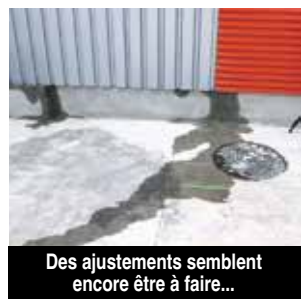
Des ajustements semblent encore être à faire...

Les problèmes inhérents à la construction de ces classes et leurs délais de livraison, sont des écueils à éviter à l'avenir. La visite du Recteur était donc l'occasion d'anticiper d'ores et déjà pour la rentrée scolaire 2019-2020. Quatorze classes en préfabriqué vont être positionnées sur le parking face aux classes modulaires afin d'accueillir les collégiens en attendant la construction du futur collège. Ces nouvelles classes vont permettre de libérer les algecos actuels du collège afin de disposer de locaux pour les classes de spécialisation du lycée. Car côté