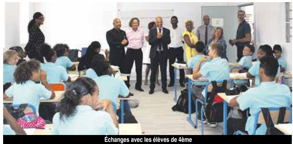
Échanges avec les élèves de 4ème

« Les nouveaux emplois du temps sont opérationnels à partir de lundi 1er avril avec les six nouvelles classes. Plus de cours le mercredi après-midi, ni le samedi matin ». Une information particulièrement appréciée par les élèves pour qui les emplois du temps vont donc revenir à la normale.