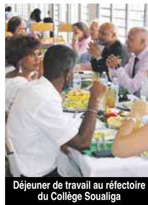
Déjeuner de travail au réfectoire du Collège Soualiga