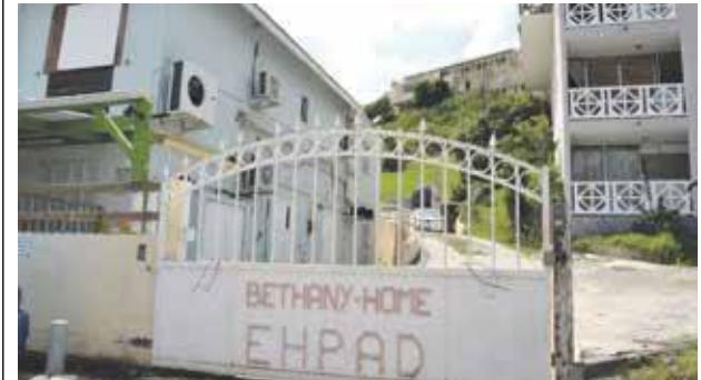
Les locaux de Bethany Home, l'EHPAD local, pour lesquels le temps semble s'être arrêté... Au risque de modifier les petites habitudes des pensionnaires, le nouveau pôle médico-social doit être tout de même attendu avec impatience.

Lors de sa venue à Saint-Martin la semaine dernière, la directrice générale de l'Agence Régionale de Santé (ARS) Guadeloupe, Valérie Denux, a annoncé que le nouveau Pôle médico-social qui sera construit à la Savane devrait être opérationnel pour le début de l'année 2022.