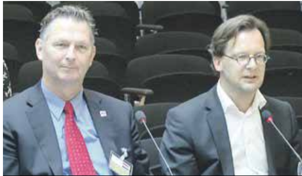
Les deux parlementaires des Pays Bas, Ronald Van Raak et André Bosman se félicitent de cette arrestation.

Figure politique de la partie sud de l'île, Theo Heyliger a été arrêté mardi matin à son domicile après une perquisition menée manu militari par les agents de l'unité anticorruption de Sint Maarten (Anti-Corruption Task Force/TBO). Il serait soupçonné d'avoir participé à des affaires de corruption, de blanchiment d'argent et d'avoir perçu et versé des pots dans le cadre de marchés publics.