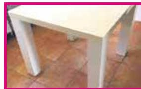
TABLE LAQUE BLANCHE , Table d'appoint carrée en laqué blanc Dimensions 80 X 80 cm Hauteur 75 cm Prix : 150 € 0690 71 50 75

iPhone 7 plus 128 Giga OR , Vendu avec Boite, écouteurs et chargeur. Prix : 400 € 06 45 66 75 12