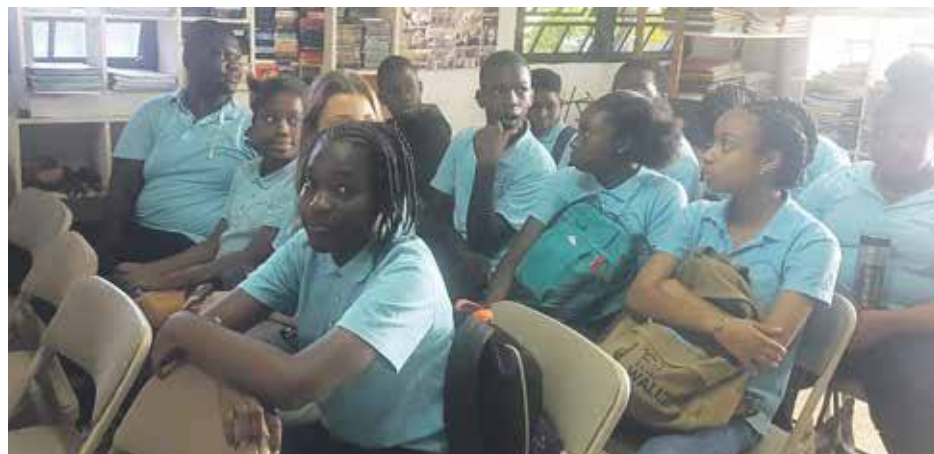
Les élèves de la première classe à horaire aménagé en musique de Saint-Martin se rendant lundi dernier pour la première fois à l'école The Music Workshop.

Car aux enseignements traditionnels dans nos systèmes d'éducation, on reconnaît désormais le bienfondé pour un meilleur épanouissement des élèves d'ajouter des enseignements artistiques. Musique, théâtre, arts plastiques... autant de disciplines qui participent d'un meilleur équilibre éducatif. Les Classes à horaires aménagées sont des classes spécifiques constituées principalement d'élèves qui ont été repérés pour leur sensibilité à la discipline proposée, pas essentiellement des élèves déjà musiciens, mais qui ont montré leur