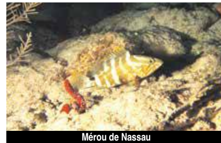
Mérou de Nassau