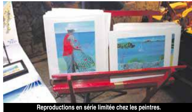
Reproductions en série limitée chez les peintres.