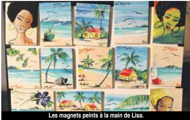
Les magnets peints à la main de Lisa.

Jeudi 14 février c'est la Saint-Valentin ! Les Mardis de Grand Case sont une véritable aubaine pour les têtes en l'air ... qui auront oublié la fête des amoureux et qui, à la dernière minute, devront trouver le cadeau idéal. Parmi tous les stands, forcément un aura de quoi les satisfaire, mais pour faciliter les choses, voici une première sélection d'objets ou d'accessoires que nous avons aimé.