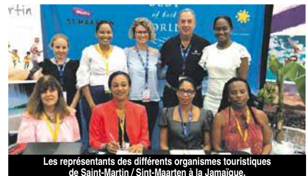
Les représentants des différents organismes touristiques de Saint-Martin / Sint-Maarten à la Jamaïque.