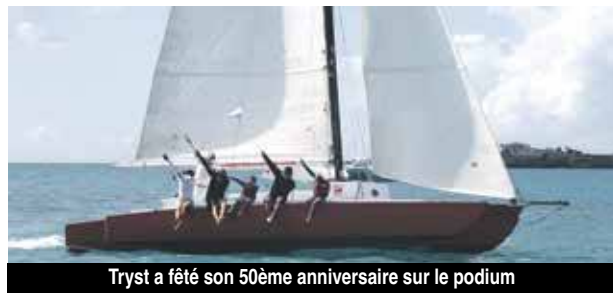
Tryst a fêté son 50ème anniversaire sur le podium

Quinze multicoques ont participé à la première édition du Caribbean Multihull Challenge qui s'est déroulé de vendredi à dimanche dernier. Trois jours de régates fort disputés au départ de Simpson Bay.