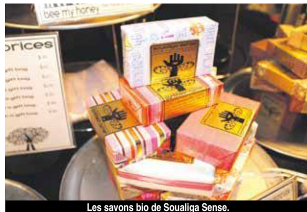
Les savons bio de Soualiga Sense.