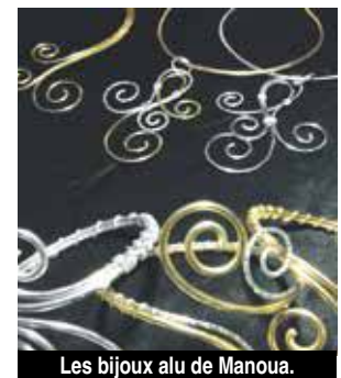
Les bijoux alu de Manoua.

Boutik qui offre un assortiment d'objets, de goodies et autres créations artisanales signées Béa et toutes estampillées Mardis de Grand Case. Dans ce large choix, on craque pour une autre nouveauté, la poupée mascotte, une petite danseuse, exotique, comme il se doit ! Bien entendu, cette liste n'est pas exhaustive, et il y a certainement d'autres créations que nous avons oublié oublié ... pour le savoir, il faut retourner aux Mardis de Grand Case, et c'est ce soir ! A.B