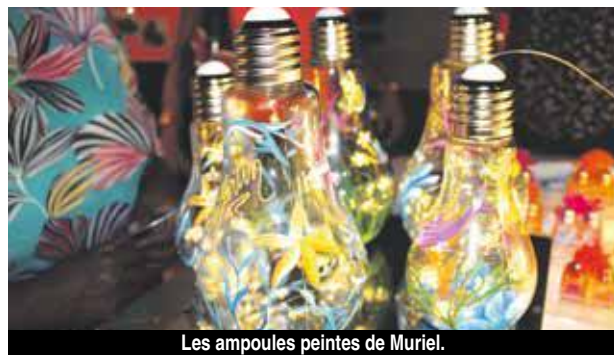
Les ampoules peintes de Muriel.

que l'on peut dénicher de nouveaux artisans-créateurs ou découvrir les nouveautés de ceux déjà connus. Les artistes peintres