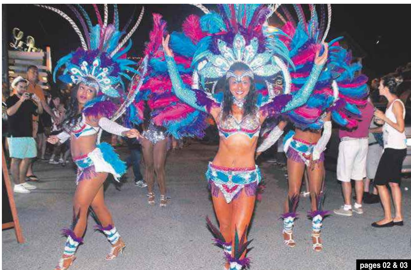
pages 02 & 03

Nautisme : le pont de Sandy Ground fait monter la colère