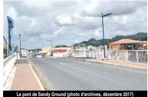
Le pont de Sandy Ground (photo d'archives, décembre 2017)

Pour les opérateurs du nautisme, pourtant peu habitués à faire parler d'eux, trop c'est trop, et puisque tout le monde semble aujourd'hui descendre dans la rue pour protester contre toutes ces formes de mépris et de mé-