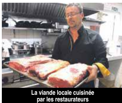
La viande locale cuisinée par les restaurateurs