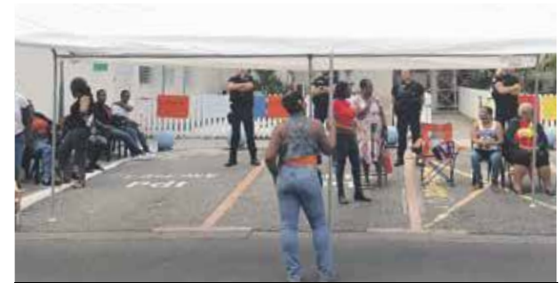
Les grévistes en "sitting" devant l'Hôtel de la Collectivité

n'étaient pas directement liées aux grévistes de la CTOS ». De même, aucune indication particulière n'a permis d'identifier les auteurs de ces « cadenassage ». Ce sont finalement les forces de l'ordre qui sont intervenues pour libérer les grilles et laisser pénétrer dans l'enceinte des établissements le personnel. Pour permettre une avancée dans les négociations, Une rencontre entre les représentants syndicaux et la préfète est prévue ce jour en préfecture. Pour mémoire, à l'appel syndical UTC-UGTG, les agents de la Caisse Territoriale des Œuvres scolaires ont déposé le 23 janvier un préavis de grève illimité qui a pris effet mercredi de la semaine dernière. V.D.