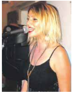
machine à chanter de 20h à 23h. (Prochaines soirées jeudi 7 février et samedi 9 février).