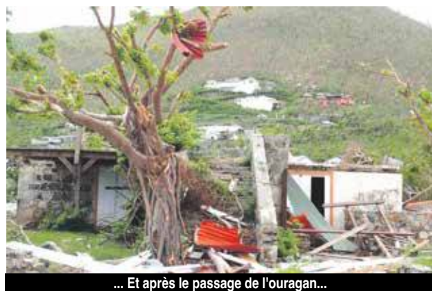
... Et après le passage de l'ouragan...

A la suite de l'abandon des activités agricoles au début du XXe siècle, les différents propriétaires de cette dernière ont exploités le site comme lieu de résidence ou d'activités commerciales. Au cours de ces occupations successives, ils ont procédé à des rénovations et modifications des lieux, tout en conservant néanmoins certains éléments d'origine.