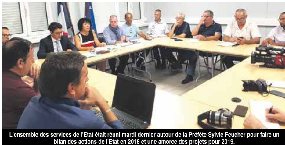
L'ensemble des services de l'Etat était réuni mardi dernier autour de la Préfète Sylvie Feucher pour faire un bilan des actions de l'Etat en 2018 et une amorce des projets pour 2019.

Création d'un observatoire des prix pour lutter contre la vie chère : Sur la base des nouveaux textes réglementaires sortis en décembre 2018, cette mission de contrôle de la vie chère par la création