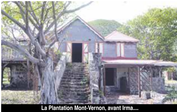
La Plantation Mont-Vernon, avant Irma...

Exploitation agricole datant de la fin du XVIIIe siècle, en activité jusqu'à la fin du XIXe, la Plantation Mont Vernon est l'un des fleurons du patrimoine de l'île. Aujourd'hui propriété de la Collectivité, elle va pouvoir renaître de ses cendres grâce à l'aide des fonds récoltés par le loto du patrimoine.