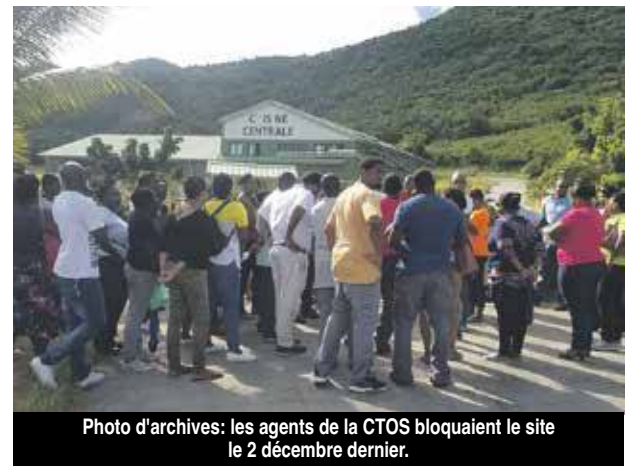
Photo d'archives : les agents de la CTOS bloquaient le site le 2 décembre dernier.