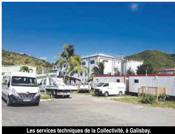
Les services techniques de la Collectivité, à Galisbay.

l'implantation des 4 classes mobiles au niveau du lycée. Les conditions de sécurité pour l'accueil des élèves sont sans cesse remises en question et le ras le bol général se fait chaque jour plus prégnant. Le Collectif Parents Elèves Enseignants (PEP) était toujours hier en attente d'informations plus précises quant à la fin de cette première tranche de travaux. Une semaine qui s'annonce donc chargée et sous tension pour les élus de la Collectivité. V.D.