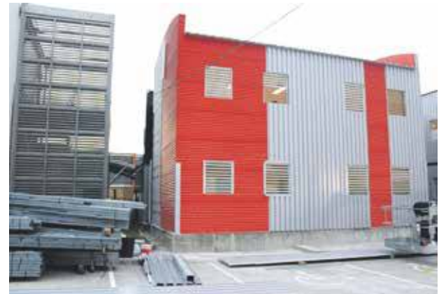
Photo d'archive (début janvier 2019) : le chantier de la Cité scolaire accuse encore des retards

Enfin, le ton pourrait encore monter à la Cité Scolaire où le chantier relatif aux six classes mobiles côté collège qui devait être achevé le 31 janvier, soit jeudi prochain, ne le sera sans doute pas. En effet, le chantier