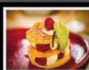
Live Music le Samedi

L'Astrolabe: Le rendez-vous des fins gourmets.