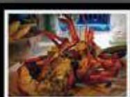
Lobster Party & Live Music le Vendredi