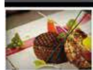
Surf & Turf Party & Live Music le Lundi