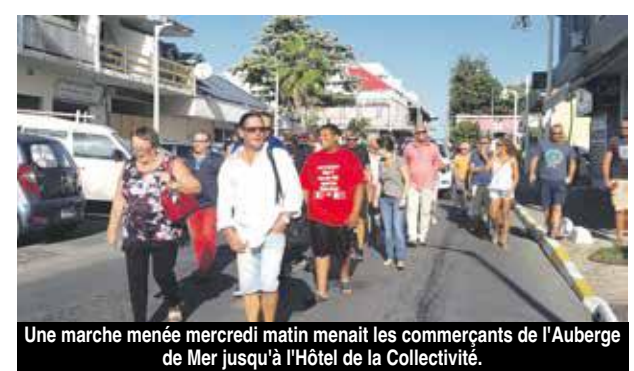
Une marche menée mercredi matin menait les commerçants de l'Auberge de Mer jusqu'à l'Hôtel de la Collectivité.