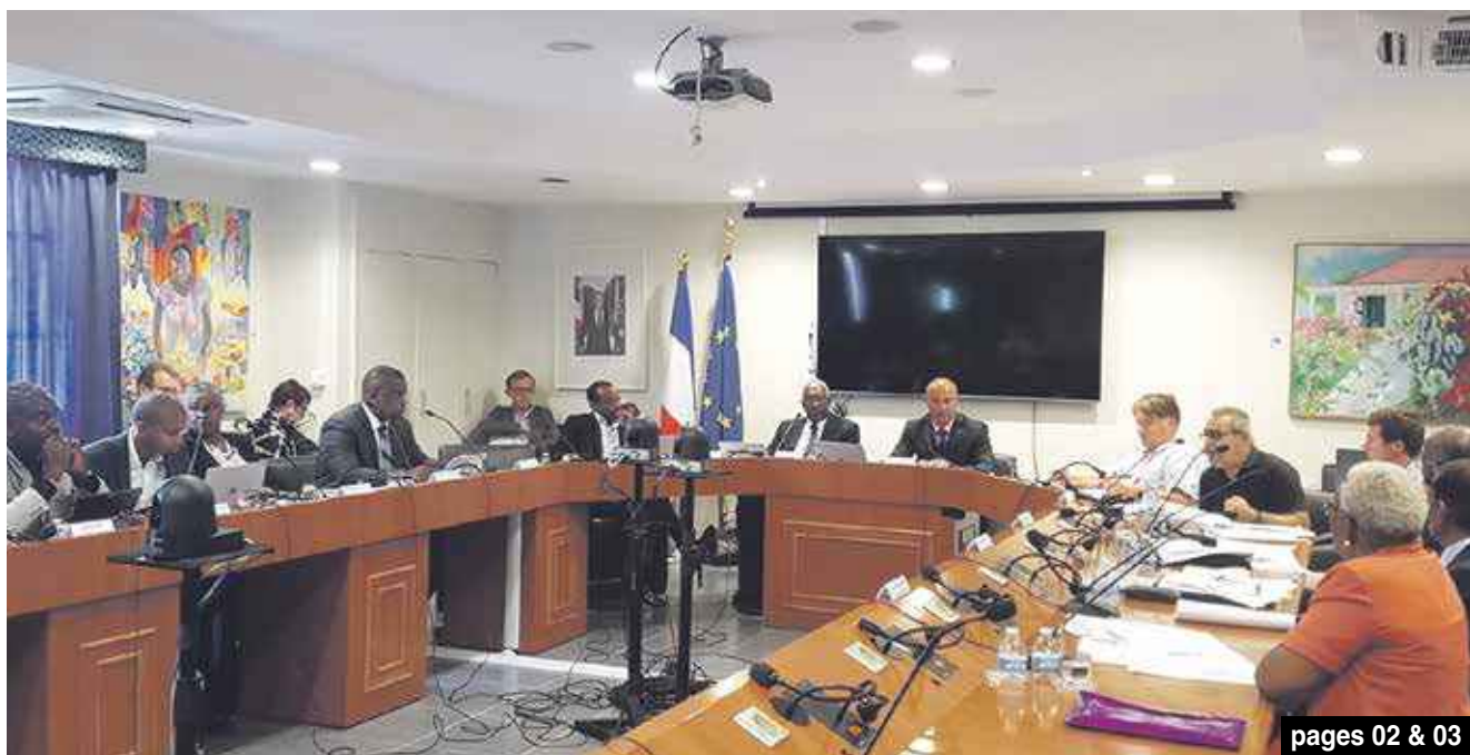
pages 02 & 03

Découverte de deux cadavres à Oyster Pond