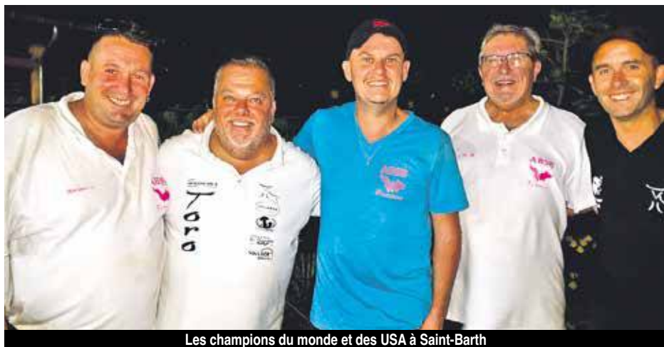
Les champions du monde et des USA à Saint-Barth

La prochaine compétition du club sera organisée le dimanche 28 octobre en doublettes arrangées sur les allées du Sand à la Baie Nettlé avec des inscriptions prévues à partir de 10h (10€) par joueur et un lancé du bouchon à 10h30. Sur place Buvette et Barbecue avec