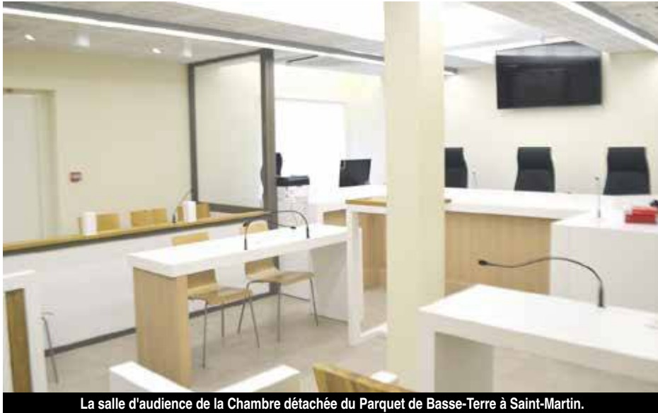
La salle d'audience de la Chambre détachée du Parquet de Basse-Terre à Saint-Martin.

Un jeune de 21 ans en manque de repère familial, vivant une vie isolée et sans soutien, a reçu la clémence du tribunal mercredi dernier, alors qu'il était convoqué pour y être jugé en comparution immédiate, après six jours d'incarcération, pour des faits de violence avec arme blanche.