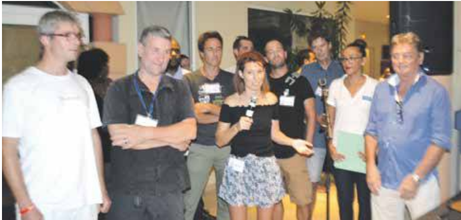
Une dizaine de journalistes spécialisés dans la presse nautique sont en excursion sur Saint-Martin et les îles alentours pour participer à la relance de l'activité.

A l'initiative de la Compagnie Moorings & Sunsail, une délégation de journalistes français, belges et suisses, spécialisés dans la presse nautique, a été invitée à venir découvrir ou redécouvrir les bijoux que nous offre le monde de la mer, à Saint-Martin et ses alentours. Une belle réception d'accueil était organisée par Métimer et l'Office de tourisme, en présence d'élus territoriaux, de personnalités locales et de la préfète Sylvie Feucher, mercredi dernier au restaurant La Terrasse du West Indies.