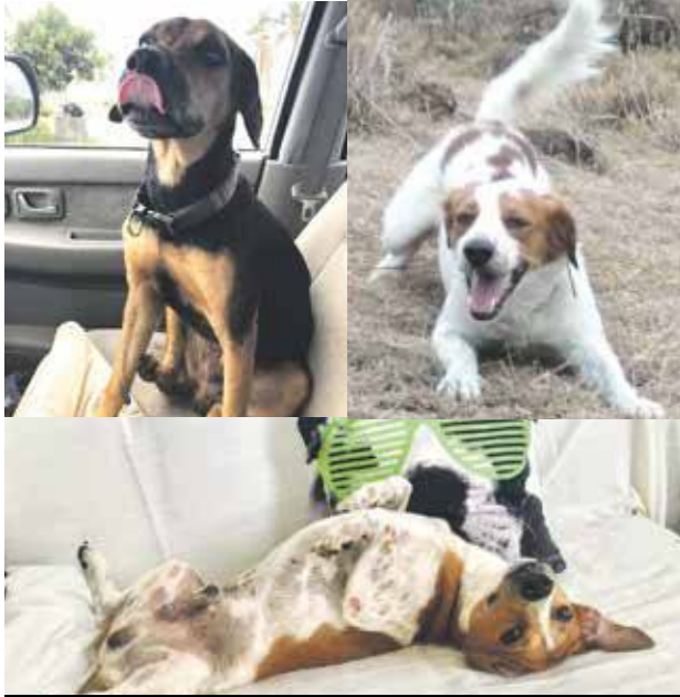
Ces trois jeunes chiens qui ont été sauvés lors de l'avant-dernière capture sont toujours en famille d'accueil en attente de leur adoption.