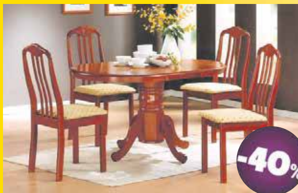
Table Ovale MACAO 199 90 119 94

MACAO CHAISE Structure en hêtre massif, assise en tissu. Dims : L 49 CM H 100 CM P 41 CM. Réf : CTHA 105488MERI - MACAO TABLE OVALE BOIS MASSIF Structure en Hêtre massif. Dims : L 100 CM H 74 CM P 200 CM. Réf : CTHA 101900MERI