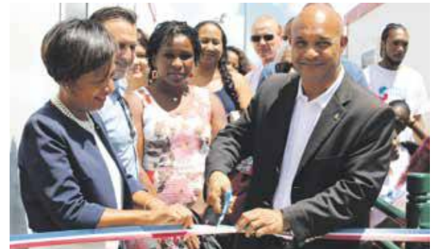
La sous-préfète Régine Pam et le Président Gibbs coupent le ruban inaugurant la nouvelle MSAP de Quartier d'Orléans.

L'Etat s'est engagé financièrement auprès de la Collectivité, à hauteur de 20 000 € pour faire naître les projets de Quartier d'Orléans et de Sandy Ground, mais aussi pour les faire fonctionner, avec un complément budgétaire de 50 000 €, pour, entre autres, la formation des jeunes du