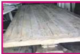
Table 10 personnes : en bois brut Prix : 400 € 0690 66 36 36