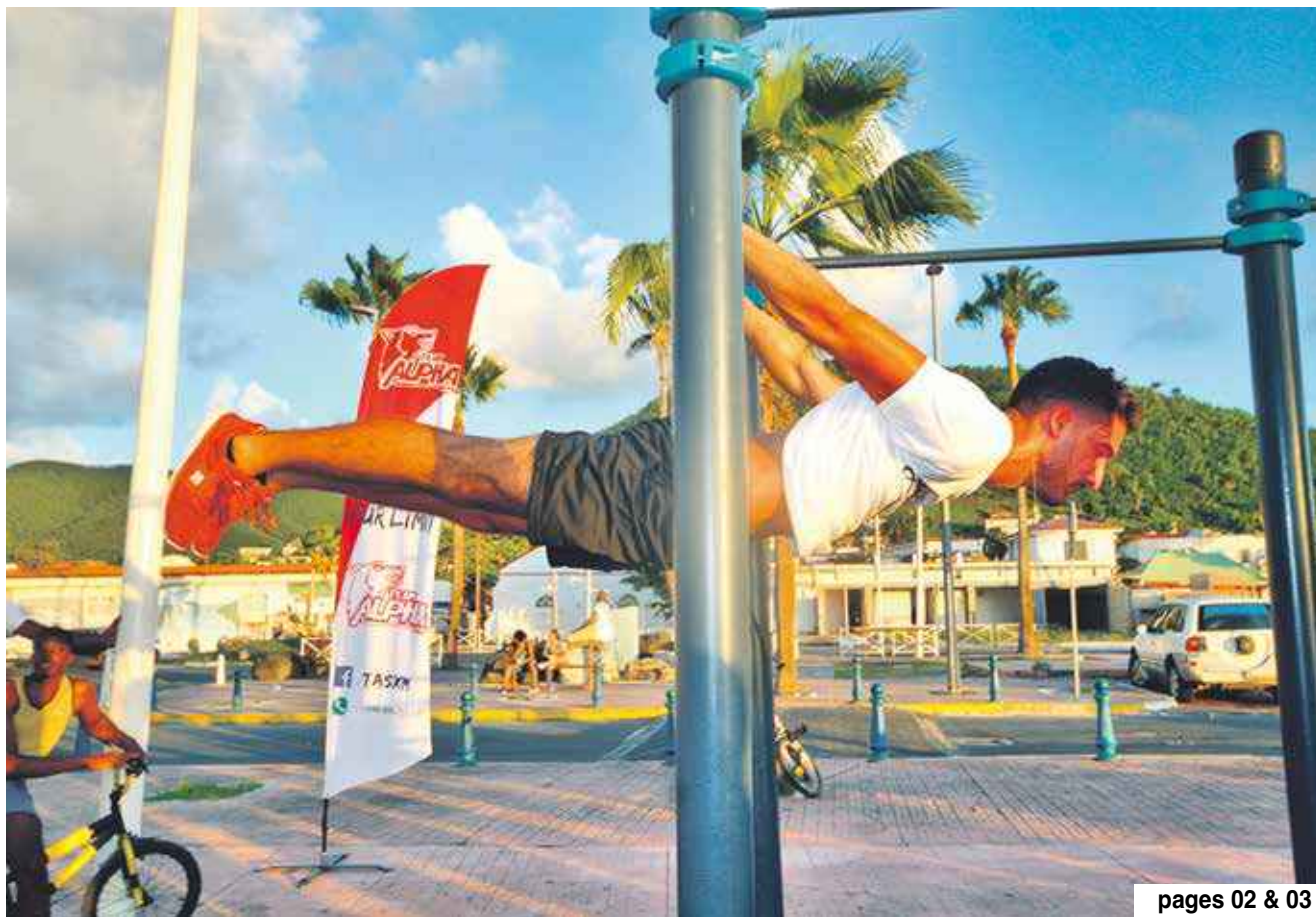
pages 02 & 03

Quartier d'Orléans a sa Maison des Services