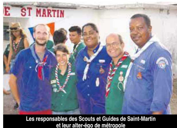
Les responsables des Scouts et Guides de Saint-Martin et leur alter-égo de métropole

jeunes. La cotisation pour l'année (qui débute en septembre) est de 39 €, complétée par une participation de 100 € pour payer toutes les activités pendant un an. Pour devenir scouts