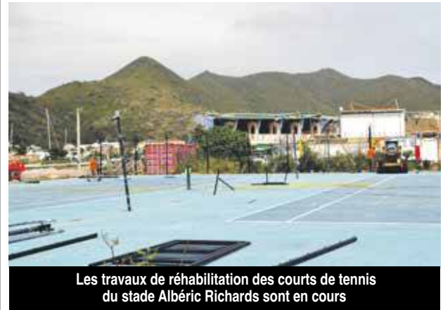
Les travaux de réhabilitation des courts de tennis du stade Albéric Richards sont en cours

Le stade Albéric Richards situé à Sandy Ground a subi de graves dommages. Les gradins qui surplombent le terrain de football et la piste d'athlétisme sont à détruire dans leur totalité.