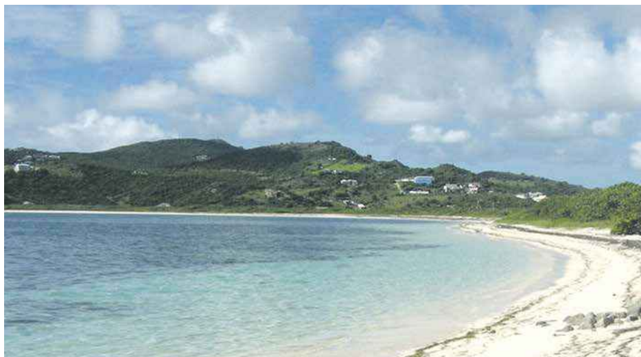
Le sable de mer doit être lavé avant toute utilisation, mais aucune structure n'existe sur l'île pour le faire.

Il est urgent d'enrayer cette pratique et ce pour plusieurs raisons.