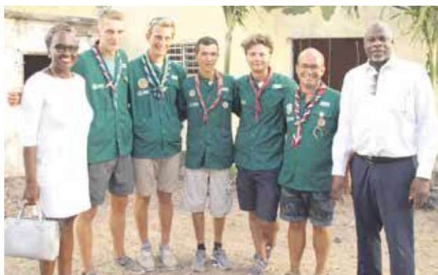
La députée et le sénateur sont venus remercier les compagnons

Le mot est peut-être trop simple, mais il exprime toute la gratitude de la population aux 87 scouts et guides de France, qui ont terminé leur mission la semaine dernière en inaugurant le local des scouts de Saint-Martin.