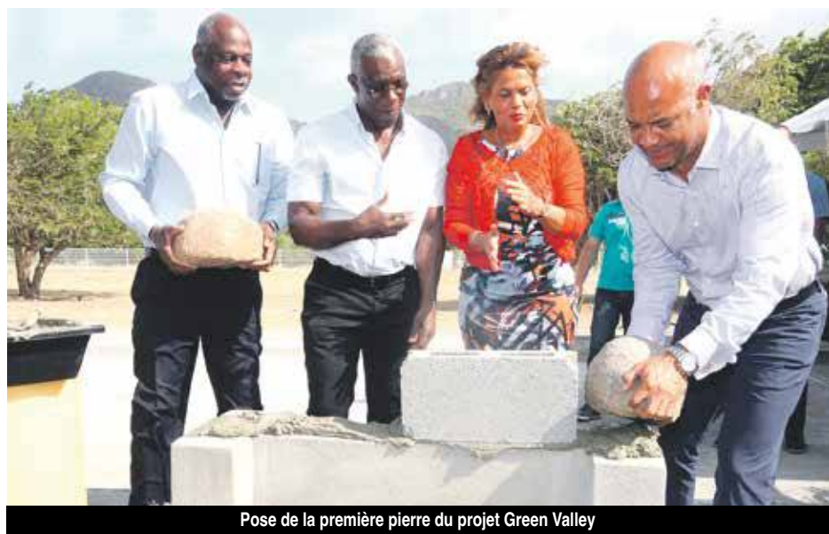
Pose de la première pierre du projet Green Valley