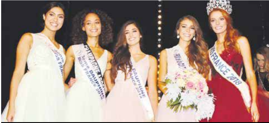
Miss France 2018 et ses quatre dauphines arrivent en fin d'après-midi à l'aéroport de Grand Case

Maëva Coucke, notre miss France 2018 débarque aujourd'hui à Grand Case accompagnée de ses quatre dauphines