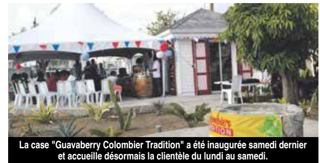
La case "Guavaberry Colombier Tradition" a été inaugurée samedi dernier et accueille désormais la clientèle du lundi au samedi.

Ce nouveau lieu typique est à visiter sans modération pour découvrir toutes les richesses du terroir de Colombier, ouvert du lundi au samedi, de 9 heures à 18 heures. V.D.