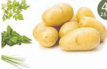
Pommes de terre