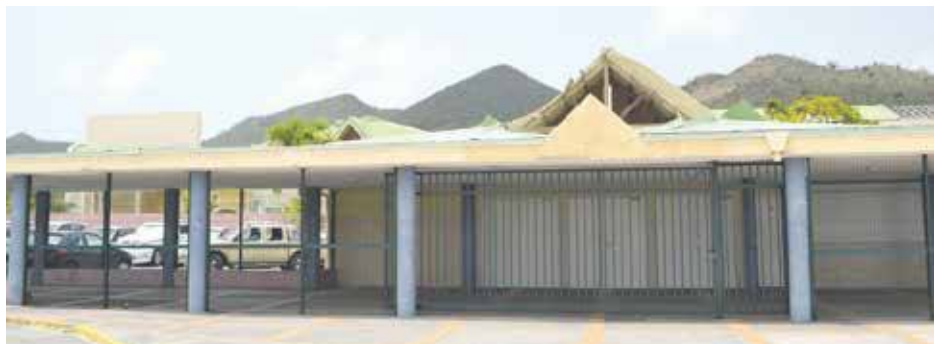
Le Collège du Mont des Accords à Concordia fera l'objet d'importants travaux courant de ces deux mois de l'été.

Le passage de l'ouragan Irma le 6 septembre 2017 a impacté 95% des bâtiments de la Collectivité. Parmi ceux-ci, les 21 établissements scolaires que comptait l'île ont tous été fortement endommagés et 3 d'entre eux ont été détruits : l'école élémentaire Nina Duverly, à Marigot, l'école primaire Emile Larmonie et le collège Soualiga, à Cul de Sac. De fait, l'année scolaire qui vient de s'écouler a été compliquée et perturbée pour tous.