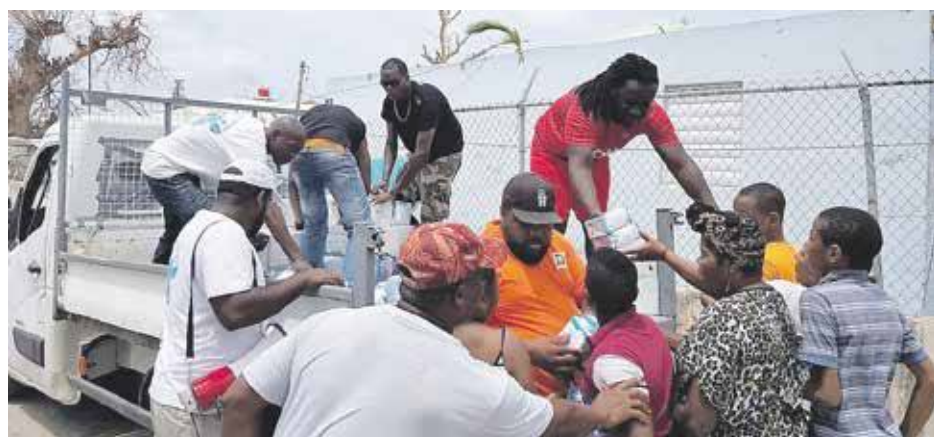
Distribution des dons dans les quartiers, après Irma

Ce même stock nourrit les 38 personnes démunies et sans abri encore accueillies à l'école Nina Duverly et qui n'ont pas encore trouvé de solution pour se reloger. Elles étaient 130 au lendemain d'Irma. La Collectivité a aidé certaines familles à quitter l'île, si elles étaient attendues ailleurs, comme c'est le cas actuellement pour une maman et ses trois jeunes enfants, qui vont rejoindre des proches en métropole dans les jours qui viennent.