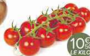
Tomates cerises grappes