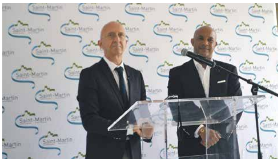
Présentation commune pour l'Etat et la Collectivité du Guide de bonnes pratiques de la reconstruction

Plus de 40 professionnels ont participé à sa réalisation et il a