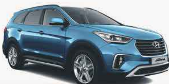
HYUNDAI GRAND SANTA FE