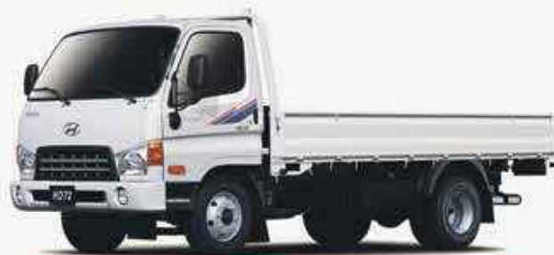
HYUNDAI HD65/75 CARGO

*Offre valable du 4 au 18 Juin 2018, sur nos modèles sélectionnés.