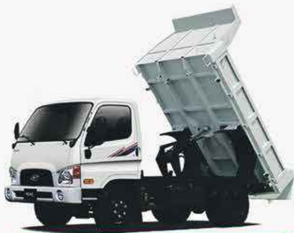
HYUNDAI HD 65/75 DUMP