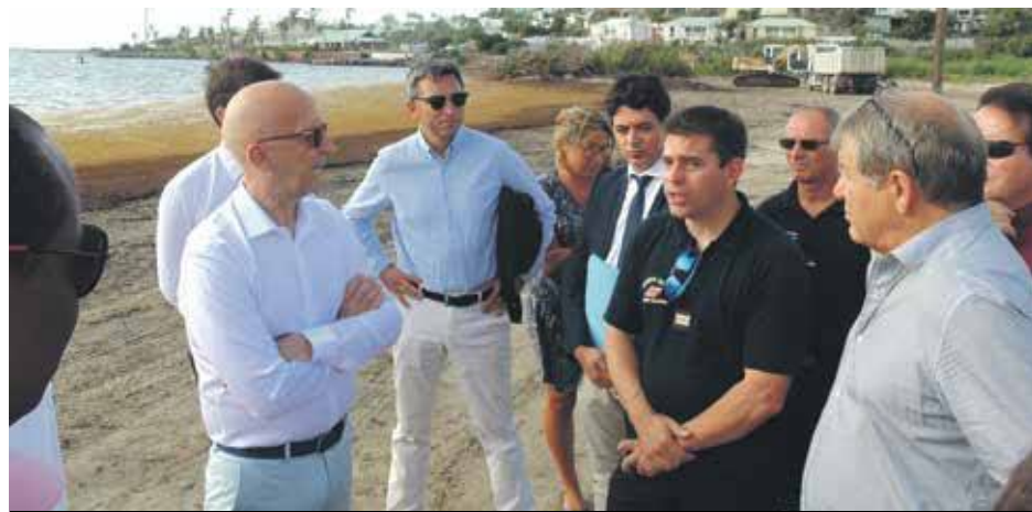
Visite de terrain, ici à Cul de Sac, pour l'ensemble des services concernés par ce fléau des sargasses

Près de 100 tonnes de sargasses par jour sont ramassées depuis le début du phénomène qui s'est déclaré courant avril. Alors qu'en 2015, une année où les échouages avaient été très importants, 1000 tonnes avaient été ramassées en trois mois. Cette année, en à peine deux mois, la collecte est de l'ordre de 2300 tonnes.