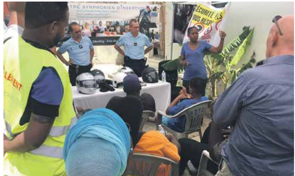
Le CSI et la BMO mobilisés pour éduquer les jeunes au port du casque

L'équipe de la BMO de St-Martin a rappelé que sa principale mission était la sécurité routière avec, depuis septembre, un rôle de prévention ; ce qui constitue une exception qui tient compte du contexte actuel de l'île. Cependant, si le seul moyen pour imposer le port du casque doit être la répression, ils devront en passer par là. Mais aujourd'hui,