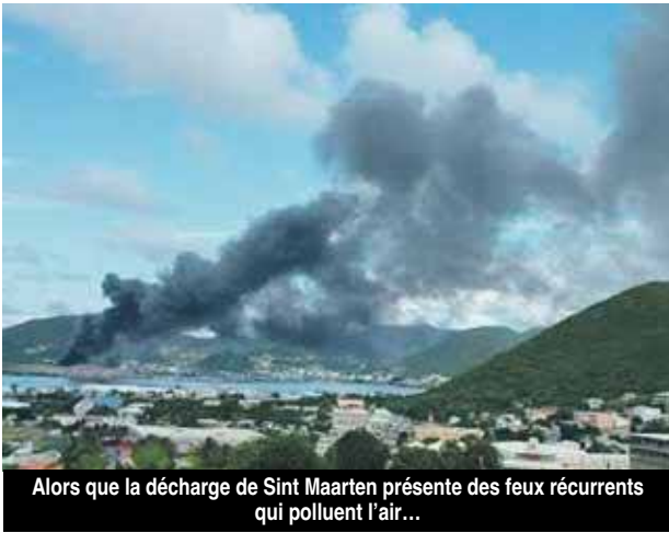
Alors que la décharge de Sint Maarten présente des feux récurrents qui polluent l'air...

97150 # 181 - MARDI 13 FÉVRIER 2018 - PAGE 06