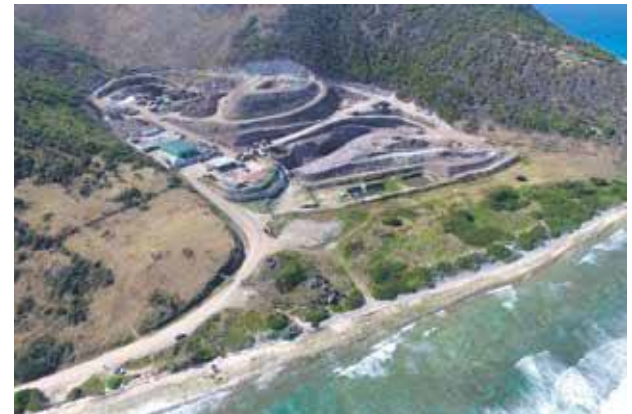
... l'écosite de Saint-Martin qui fonctionne depuis Irma dans des conditions difficiles, est toutefois considéré comme étant à la pointe du savoir-faire dans la gestion et la valorisation des déchets.

Sint Maarten va donc avoir besoin de l'Union européenne. Toutefois, son statut de Pays et Territoire d'Outre-mer (PTOM) ne lui confère pas un accès aux financements européens aussi étendu que celui de la partie française, qui jouit d'un statut de Région Ultrapériphérique (RUP).