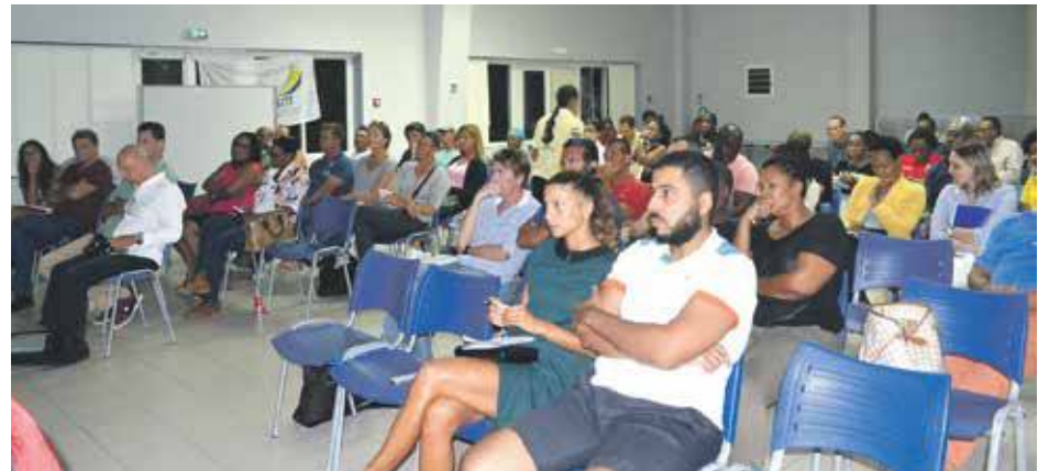
Les représentants des associations sportives étaient à l'écoute de la présentation du schéma de développement. Leurs avis sont attendus.

Pour l'heure, l'urgence concerne le sport pour les élèves, notamment ceux qui présentent des examens qui comportent des épreuves sportives. Les élèves