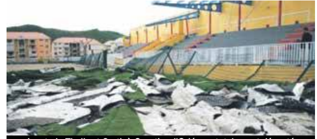
Le stade Thelbert Carti, à Quartier d'Orléans, totalement dévasté par l'ouragan Irma