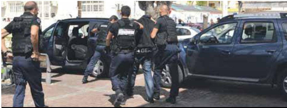
A la sortie du tribunal, les trois hommes ont été escortés jusqu'à l'aéroport de Grand Case, direction la prison de Basse-Terre.

Les trois individus impliqués dans le braquage de la Loterie Farm, lundi matin, puis interpellés par la gendarmerie au rond-point de Hope Estate à l'issue d'une course poursuite, étaient présentés mercredi matin devant le juge pour une comparution immédiate.