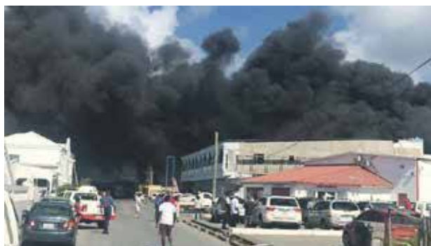
DES INCENDIES EN PARTIE HOLLANDAISE QUI INCITENT À LA RÉFLEXION

Dans la même journée, en fin d'après-midi, un second feu s'est déclaré, au Paradise Mall, toujours toujours en partie hollandaise à Cole Bay. A priori un départ dû à un problème électrique. Celui-ci a rapidement pu être contrôlé.