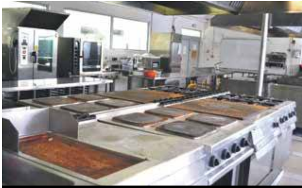
Le matériel de cuisine et de restauration est rouillé, totalement inutilisable.

Depuis la rentrée officielle des classes, en novembre dernier, les élèves du lycée de Concordia, engagés dans des filières professionnelles et techniques, n'ont pas accès aux cours pratiques. Les ateliers et le matériel sont inexploitable. Une situation alarmante pour les élèves face aux examens qui approchent à grands pas.