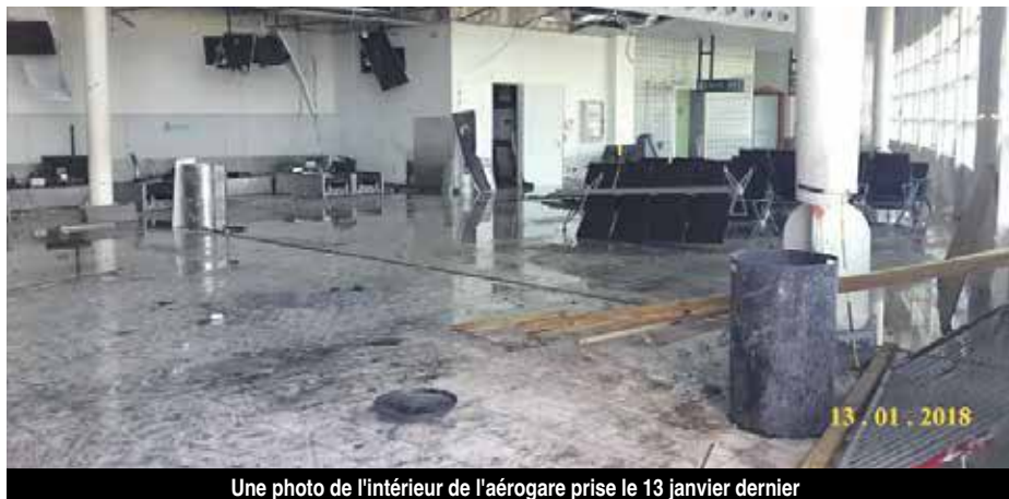
Une photo de l'intérieur de l'aérogare prise le 13 janvier dernier