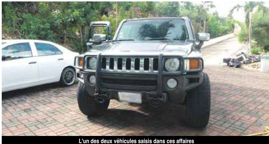
L'un des deux véhicules saisis dans ces affaires

Le premier chantier à avoir été contrôlé, à la Savane, a révélé trois salariés étrangers non déclarés. Le chef d'entreprise est convoqué, avec le maître d'ouvrage, devant le tribunal correc-