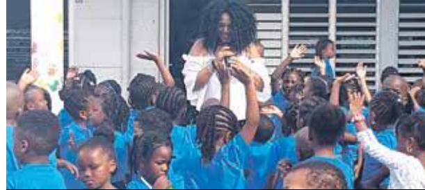
Les petits élèves de l'école maternelle Siméonne Trott vont pouvoir réintégrer leurs murs lundi prochain

Pendant les vacances des fêtes de fin d'année, un projet de boycott de la reprise des classes prenait naissance sur les réseaux sociaux. Des parents d'élèves en colère face aux rythmes scolaires désorganisés du fait des locaux encore non réparés, envisageaient en effet de ne pas envoyer leurs enfants à l'école. Un projet a priori mort dans l'œuf.