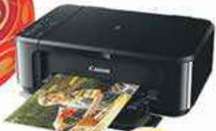
IMPRIMANTES à partir de 41,99€