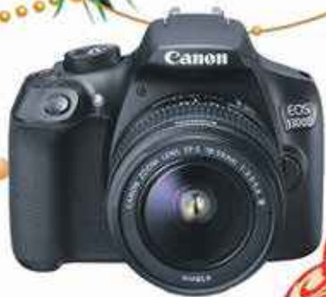
CANON EOS 1300D