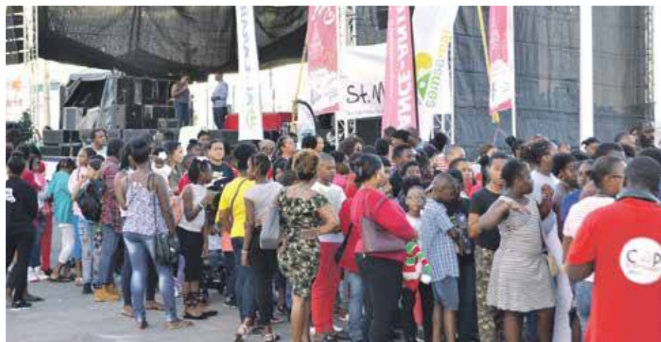
Les 3500 cadeaux ont été distribués aux enfants qui s'étaient préalablement inscrits dans un stand de l'Office de tourisme. Une longue file d'attente s'est rapidement formée devant la tente où les attendait le Père Noël.