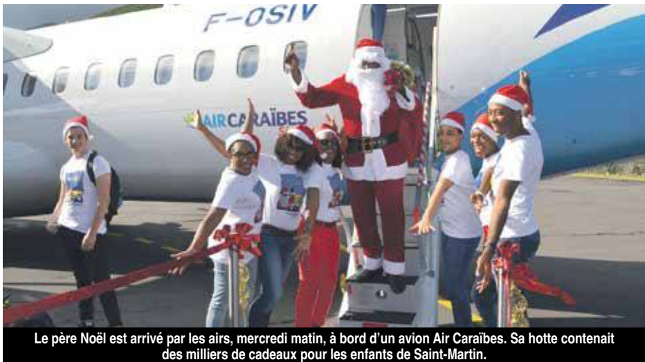
Le père Noël est arrivé par les airs, mercredi matin, à bord d'un avion Air Caraïbes. Sa hotte contenait des milliers de cadeaux pour les enfants de Saint-Martin.

Une journée de mercredi qui fut toute en surprises et qui est venue égayer cette fin d'année pour des milliers d'enfants et leur famille.