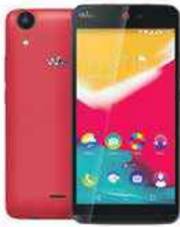
WIKO RAINBOW JAM