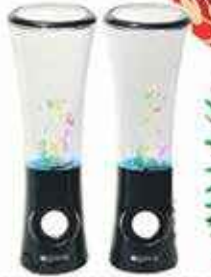
WAATECK WATERDANCE ENCEINTES