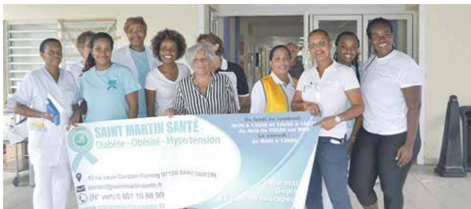
Réunis autour de Saint-Martin Santé, les professionnels de santé ont eu une mobilisation de toutes les heures pour apporter leur soutien à la population.

Environ 8 à 10% de la population saint-martinoise souffre du diabète. Des personnes diabétiques qui ont dû gérer quotidiennement leur pathologie malgré le cataclysme.