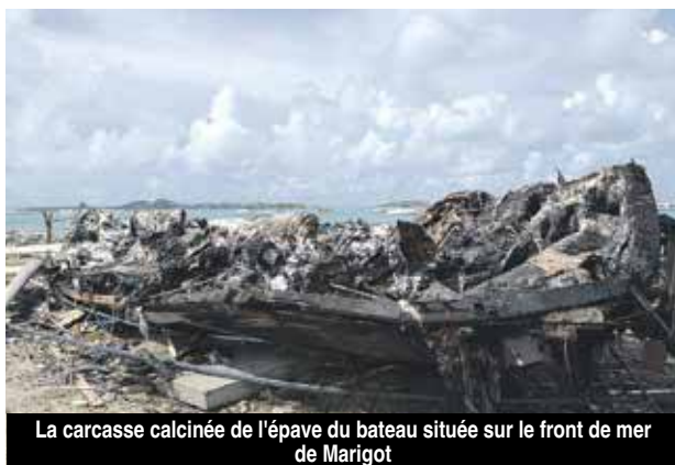
La carcasse calcinée de l'épave du bateau située sur le front de mer de Marigot

Un incendie s'est déclaré mercredi en début de matinée dans l'un des bateaux qui s'était d'abord retrouvé dans le cimetière à la suite de l'ouragan Irma et qui avait ensuite été déplacé de l'autre côté de la route, côté mer. Arrivés rapidement sur les lieux, les pompiers ont mis plusieurs heures à circonscrire l'incendie, obligeant la fermeture de la route à la circulation. Une enquête a été ouverte par la