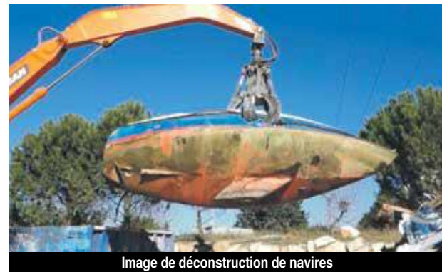
Image de déconstruction de navires