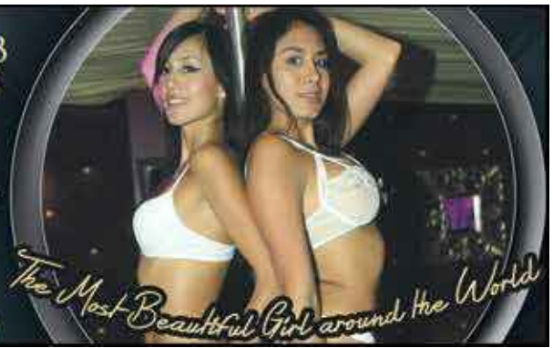
The Most Beautiful Girl around the World

Ask for special Birthday & Bachelor Parties, Private room Call 1 721 587 0055