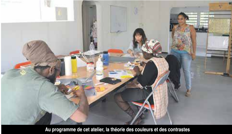
Au programme de cet atelier, la théorie des couleurs et des contrastes

Nous l'avions annoncé en juin dernier, Saint-Martin Art School, la première école pour les métiers de l'artisanat d'art à Saint-Martin, a ouvert ses portes. La rentrée qui devait avoir lieu en septembre a été reportée pour les raisons que l'on connaît... Et après de nombreuses heures alimentées à l'huile de coude pour remettre en état les locaux, la toute nouvelle école a accueilli ses stagiaires début novembre.