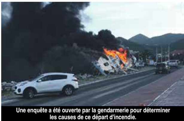
Une enquête a été ouverte par la gendarmerie pour déterminer les causes de ce départ d'incendie.

Un incendie s'est déclaré mercredi en début de matinée dans l'un des bateaux qui s'était d'abord retrouvé dans le cimetière à la suite de l'ouragan Irma et qui avait ensuite été déplacé de l'autre côté de la route, côté mer. Arrivés rapidement sur les lieux, les pompiers ont mis plusieurs heures à circonscrire l'incendie, obligeant la fermeture de la route à la circulation. Une enquête a été ouverte par la