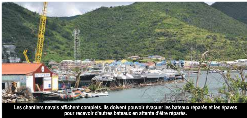
Les chantiers navals affichent complets. Ils doivent pouvoir évacuer les bateaux réparés et les épaves pour recevoir d'autres bateaux en attente d'être réparés.

avaient été placés avant le passage de l'ouragan. Les bateaux réparables et réparés sont prêts à quitter les chantiers, quant aux épaves elles doivent également être évacuées. Ce, afin de laisser la place dans les chantiers navals à d'autres navires en vue d'être réparés. Ces derniers étant principalement situés à l'intérieur du lagon, il est impératif de pouvoir y rentrer et en ressortir.