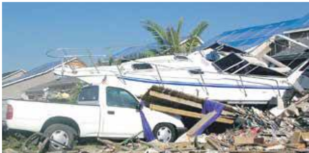
Voitures, bateaux, les épaves à retirer constituent un véritable chantier.

Environ cinq cents bateaux sont destinés à la destruction. De même, 65% des véhicules assurés ont été déclarés épaves par les assurances. Toutes ces épaves vont devoir trouver leur voie d'évacuation.