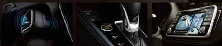
Haut-parleurs UltraNearfield™ Bose | Bouton de démarrage Ignition | Écran Pancramique intelligent