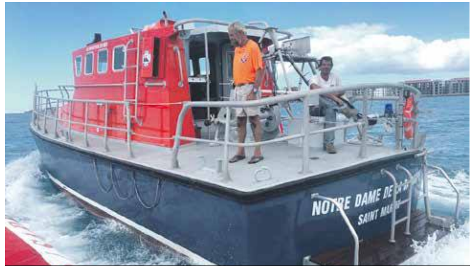
La vedette Notre-Dame de la Garoupe a retrouvé son port d'attache, à la Marina Fort Louis, après plus de trois ans d'absence. Elle n'est toutefois pas encore totalement opérationnelle et devrait l'être prochainement.