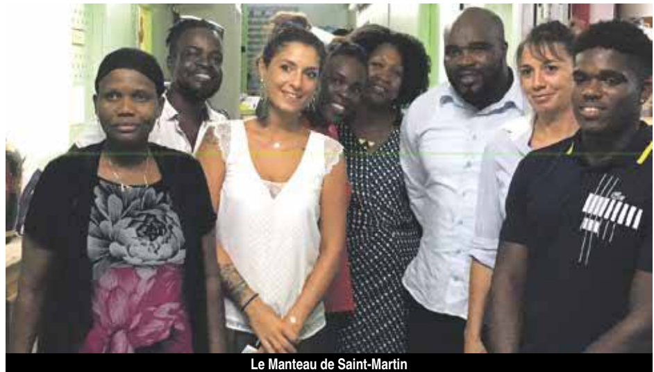
Le Manteau de Saint-Martin

Son séjour de 3 jours sur l'île, mené tambour battant, est axé autour de 3 thèmes forts : le social, l'éducatif et le sport. Ponctué d'anecdotes et de situations vécues, chaque visite était prétexte à établir un véritable état des lieux des besoins.