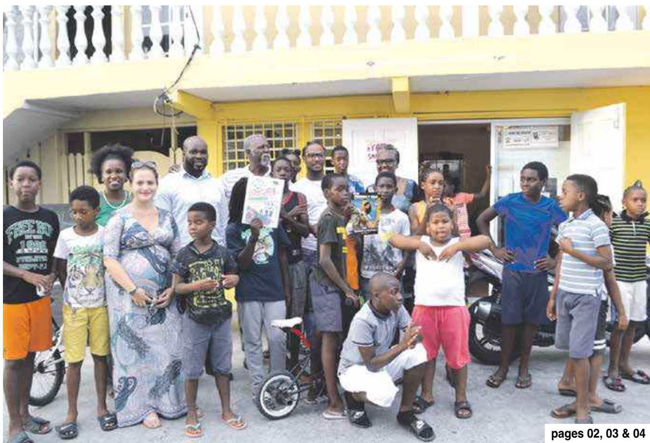
pages 02, 03 & 04

Journée Nationale SNSM : Hommage à la station de Saint-Martin