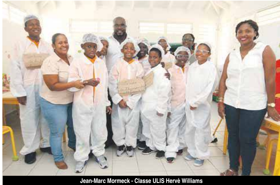
Jean-Marc Mormeck - Classe ULIS Hervé Williams