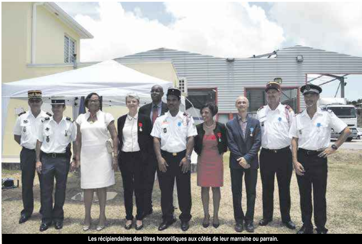
Les récipiendaires des titres honorifiques aux côtés de leur marraine ou parrain.