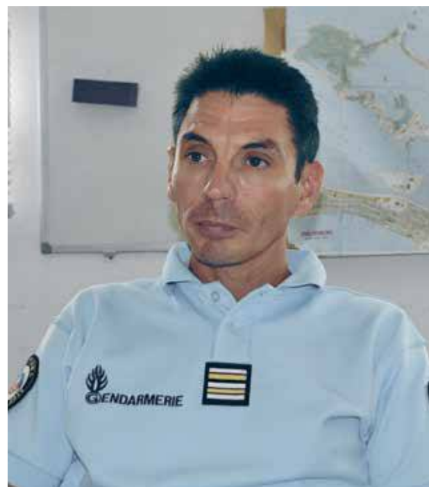
Le lieutenant-Colonel Sébastien Manzoni

La gendarmerie de Saint-Martin reconduit pour cette année l'Opération Tranquillité Vacances. Un dispositif qui revêt pour cette année un caractère particulier avec le départ annoncé de nombreuses personnes pour toute la période de la saison cyclonique.